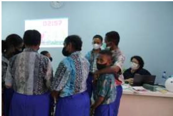
Gambar 3 : Interaksi peserta dalam kelompok – Modul “Siapakah Aku?”

Setelah peserta menuliskan materi tentang profil diri, kemudian fasilitator di masing-masing kelompok akan menjelaskan aturan mainnya. Setiap kelompok menyanyikan 1 lagu bersama-sama, dengan mengedarkan balon berurutan ke masing-masing peserta. Setelah lagu dihentikan oleh fasilitator maka orang yang memegang balon akan menyampaikan penjelasan tentang profil dirinya. Setelah selesai, lagu kembali dinyanyikan, dan kemudian balon kembali diedarkan. Jika saat lagu dihentikan, dan balon dipegang oleh peserta yang sudah menyampaikan materi maka peserta tersebut boleh menunjuk siapapun temannya yang belum mendapatkan giliran. Setelah semuanya mendapatkan giliran maka permainan akan selesai.