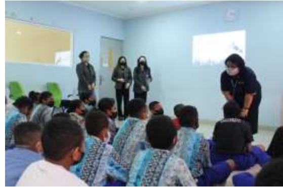
Gambar 2 : Interaksi fasilitator pada modul 1- Aku bisa

hanya berbicara tapi berani mengkespresikan diri dengan baik dan berani.