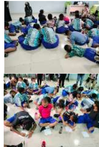
Gambar 4. Persiapan Materi Peserta dalam Modul 3 – Aku dan Dunia

Dengan topik-topik beragam seperti (1) apa yang membuatmu tertawa hari ini?, (2) apa yang paling kamu suka dari dirimu sendiri?, (3) apa warna pakaian kesukaanmu?, (4) apa cita-cita dan impianmu?, (5) sebutkan dua makanan favoritmu?, (6) apa yang membuatmu sedih?, (7) apa yang membuatmu marah?, (8) apa yang membuatmu takut?, (9) apa lagu yang menjadi kesukaanmu?, (10) Binatang apa yang paling kamu suka?, (11) siapakah orang yang paling kamu sayangi?, (12) jika bisa melakukan apapun hari ini, apa yang paling ingin kamu lakukan?, (13) kalau kamu superhero, apa yang ingin kamu lakukan?. Topik-topik tersebut bisa dipilih peserta, dan pemilihan topik dibuat agar membantu peserta untuk mulai memahami identitas diri mereka dan bagaimana mereka berbeda dari orang lain, untuk membantu mereka bisa mencari pengakuan dan penerimaan dari teman sebaya dan lingkungan sosial mereka. Disini peserta dituntut untuk mengembangkan pemahaman tentang emosi, dan mengelola perasaan. Proses ini bisa membangun bukan saja keberanian tetapi kemandirian bagi siswa sekolah dasar untuk mau mengurus diri sendiri, berpikir kritis, dan mengatasi tantangan ((Lais, 2023).