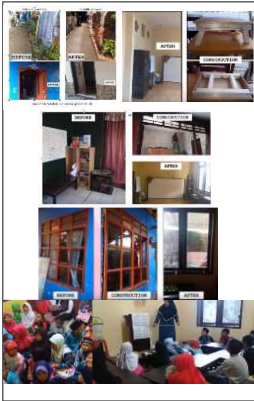
Gambar 3. Pembangunan sarana tahun 2019.