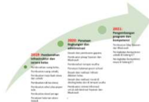
Gambar 2. Roadmap pengabdian masyarakat.

pengelolaan madrasah didukung oleh dana internal kampus Universitas Telkom. Mengingat pendidikan para ustadz/ah berlatar belakang pendidikan agama setingkat sekolah lanjut tingkat atas, maka pelatihan MS Office dilaksanakan dalam 2 tahap, yaitu dasar dan lanjut. Gambar 2 menunjukkan roadmap kegiatan masyarakat multi-years dari 2019 hingga 2021 dan karena COVID-19, pekerjaan diperpanjang hingga 2022.