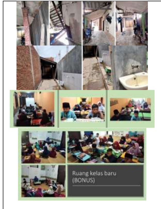
Gambar 5. Pembangunan sarana tahun 2022 dan suasana kelas yang baru.