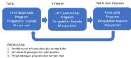
Gambar 1. Alur pelaksanaan program.

Pelaksanaan PkM melibatkan beberapa pihak yaitu Universitas Telkom sebagai pelaksana, dan Yayasan adalah Yayasan Darul Muttaqin Al-‘Insani mitra sasar PkM yang keterkaitannya diilustrasikan di Gambar 1. Setiap tahapan implementasi dilakukan evaluasi dan hasilnya menjadi umpan-balik bagi tahapan selanjutnya.