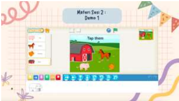
Gambar 5. Soal level 1

membuat animasi yang mirip dengan soal. Soal level 1 dapat dilihat pada gambar 5.