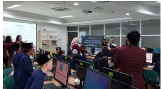
Gambar 3. Kegiatan pembelajaran di laboratorium

Kegiatan pembelajaran dilaksanakan di fasilitas lab praktikum dengan dibantu oleh 10 orang asisten yang bertugas untuk membantu peserta dalam menghadapi kendala di saat penerimaan materi.