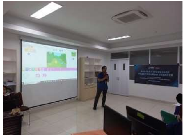
Gambar 4. Suasana kegiatan workshop

materi sesi 1, peserta langsung mencoba tahap demi tahap sesuai modul yang diperagakan langsung di depan oleh narasumber. Gambar 4 menunjukkan suasana kegiatan workshop yang dilakukan di laboratorium.