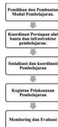
Gambar 1. Metode Pelaksanaan

Studi kasus: Metode ini melibatkan analisis dan diskusi tentang situasi atau masalah nyata yang relevan dengan topik workshop . Peserta diberi studi kasus atau skenario, kemudian diminta untuk menganalisisnya, mengidentifikasi masalah, dan mencari solusi yang mungkin. Sedangkan pelaksanaan kegiatan ini melalui beberapa tahap yang dapat diuraikan sebagai berikut: