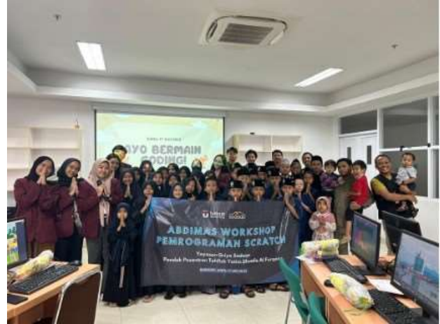
Gambar 7. Dokumentasi foto bersama peserta

ini dapat bergerak maju dengan fokus yang jelas dan memberikan manfaat yang signifikan kepada peserta dan masyarakat di sekitarnya. Gambar 7 adalah dokumentasi foto bersama peserta program pengabdian masyarakat.