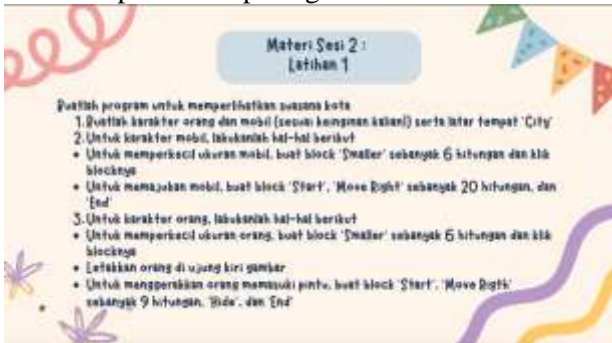
Gambar 6. Soal level 2

Berikutnya, pada level 2, peserta diminta mengerjakan soal sesuai dengan instruksi di layar. Di level ini peserta melakukan analisis dari instruksi dan memvisualisasikan animasi yang akan dibuat. Soal level 2 dapat dilihat pada gambar 6.