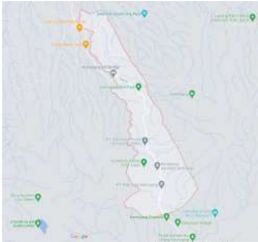
Gambar 1. Posisi Desa Laksana pada Google Maps

pusat kota Bandung and dapat ditempuh sejauh kurang lebih 1 jam 40 menit dengan menggunakan mobil. Mata pencaharian utama masyarakatnya adalah wiraswasta dan buruh tani, dan sisanya adalah petani, buruh pertukangan dan karyawan.