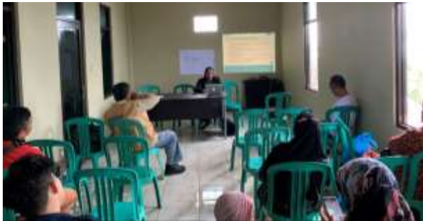
Gambar 3. Suasana kegiatan pelatihan pembuatan paket wisata

Setelah penyampaian materi, peserta diminta untuk melakukan diskusi dan mencoba untuk menyusun paket wisata yang cocok diimplementasikan di Desa Laksana. Para peserta sangat antusias dalam melakukan tugas ini seperti yang ditunjukkan pada Gambar 3. Pada akhir pelatihan, peserta diminta untuk mengisi survey terkait kepuasan terhadap kegiatan dan saran untuk perbaikan.