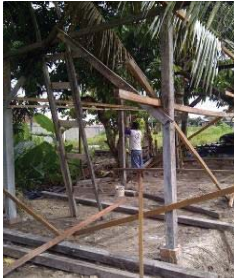
Gambar. 5 Langkah awal kumbung