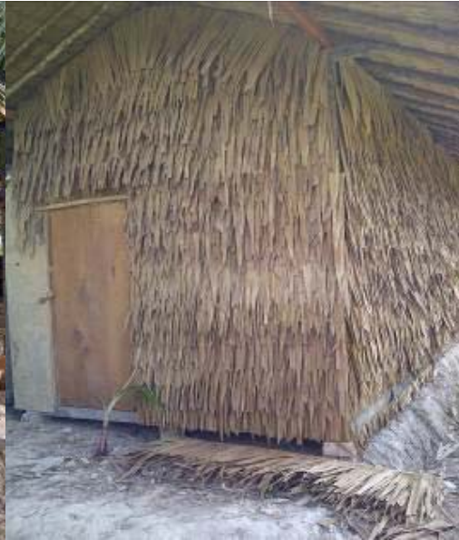
Gambar 2. Kumbung dari Luar