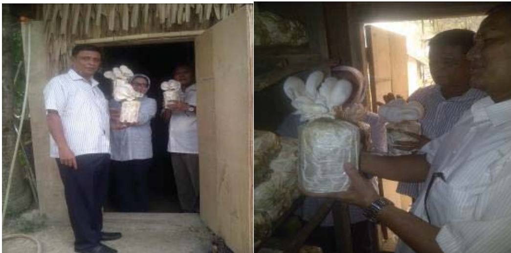
Gambar 3 Tim Abdimas UPBJJ-UT Jambi sedang Monitoring perkembangan jamur tiram dalam kumbung.

Pelatihan budidaya jamur tiram sangat membantu petani dan ibu-ibu rumah tangga warga Kelompok tani Cipta Nugraha RT 44 Kelurahan Talang Bakung Jambi Selatan dan dirasakan sangat besar manfaatnya bagi petani. Petani menjadi lebih handal dalam memanfaatkan lingkungan untuk pemberdayaannya