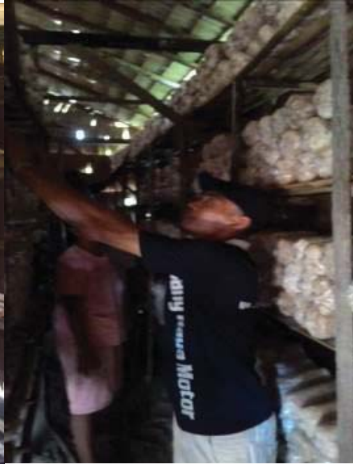
Gambar 4 Petani menyusun baglog