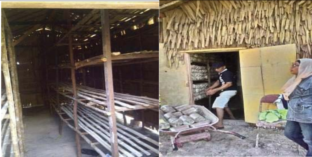
Gambar 2. Rak Kumbung Tempat susunan jamur tiram