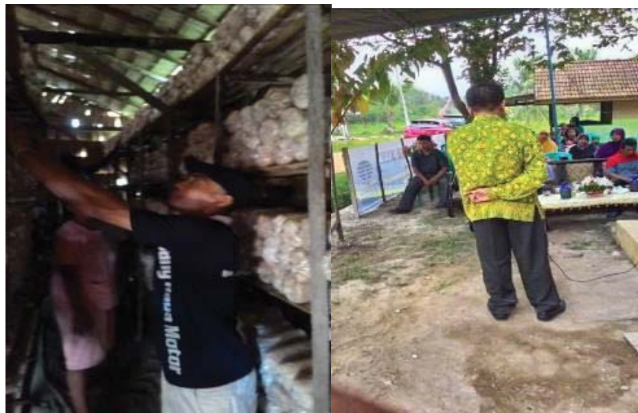
Gambar 3. Pelatihan menyusun baglog dalam kumbung