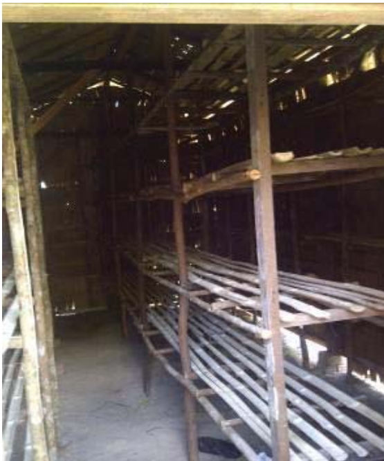
Gambar 3. Kumbung dari dalam