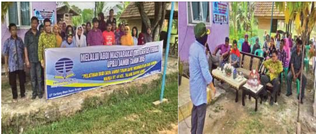
Gambar 1. Pembukaan Pelatihan ole Ibu Camat Jambi Selatan

Metode yang digunakan adalah metode dempot dan praktek langsung kepada kelompok tani dengan melibatkan warga masyarakat kelompok tani Cipta Nugraha RT 44 Kelurahan Talang Bakung. Pertama-tama dilakukan penyuluhan bersama Tim Abdimas UPBJJ-UT Jambi, mengundang kelompok tani Cipta Nugraha, Ibu Camat Jambi Selatan, Pak Lurah, dan Pak RT se Kelurahan Talang Bakung , tentang budidaya jamur tiram seperti gambar berikut: