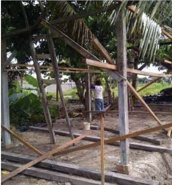
Gambar 1. Dasar Kumbung