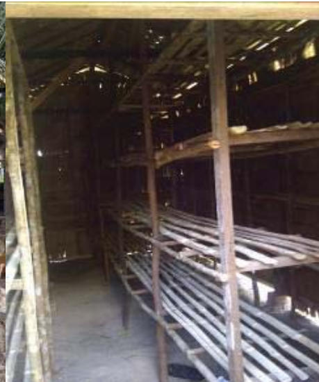
Gambar 6. Bagian dalam kumbung