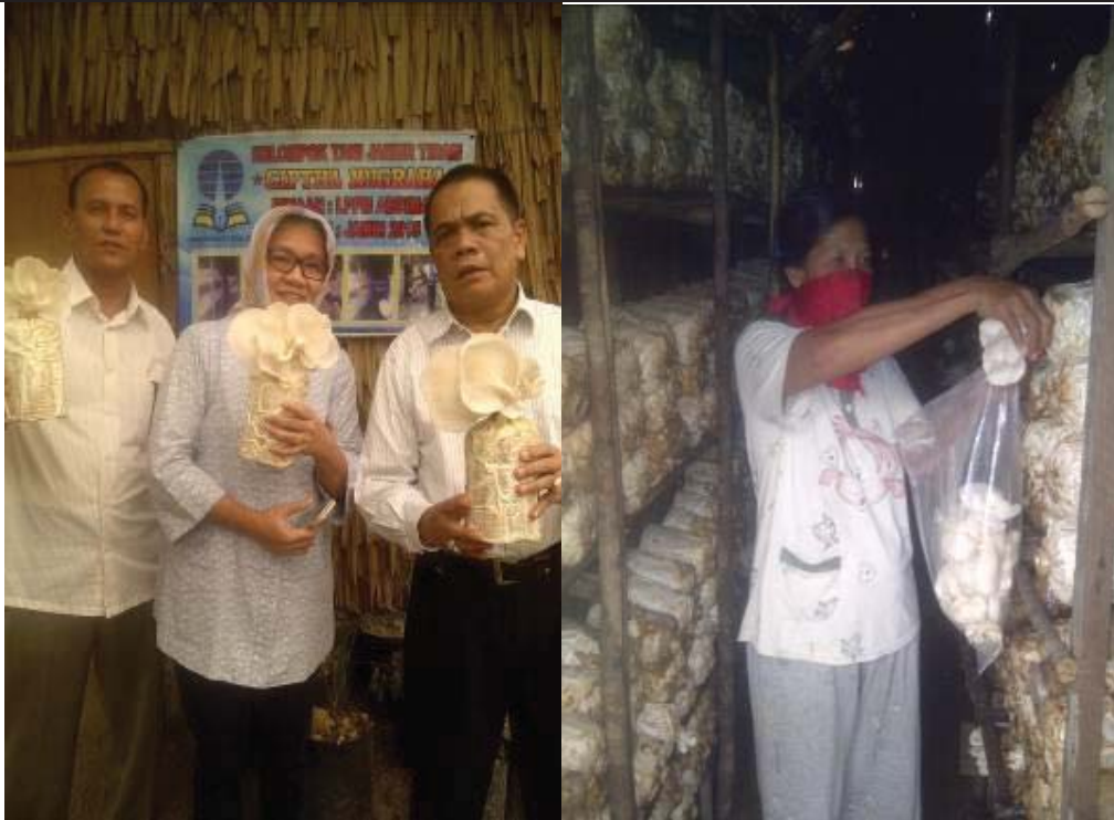
Gambar 1. Jamur sudah mulai berbuah . Gambar 2. Petani sedang memetik buah