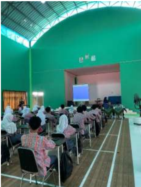
Gambar 3 Proses Literasi STEM pada tahun ketiga

untuk santri, modul pembelajaran, dan terbentuknya ekstrakurikuler robotika di Pondok Pesantren Pembangunan Sumur Bandung (P3SB). Kegiatan tahun ketiga dilakukan di SMAN 1 Bojongsoang pada 17 Mei 2023, dengan jumlah peserta 30 orang siswa dan 3 orang guru. SMAN 1 Bojongsoang sangat unik dari sisi latar belakang karena mayoritas berasal dari keluarga menengah ke bawah, dan mayoritas lulusannya langsung bekerja di pabrik yang ada di sekitar lokasi sekolah. Pelaksanaan pengenalan pemrograman dan robotika diharapkan mampu memberi pemahaman kepada pihak sekolah maupun siswa terkait pentingnya literasi STEM.