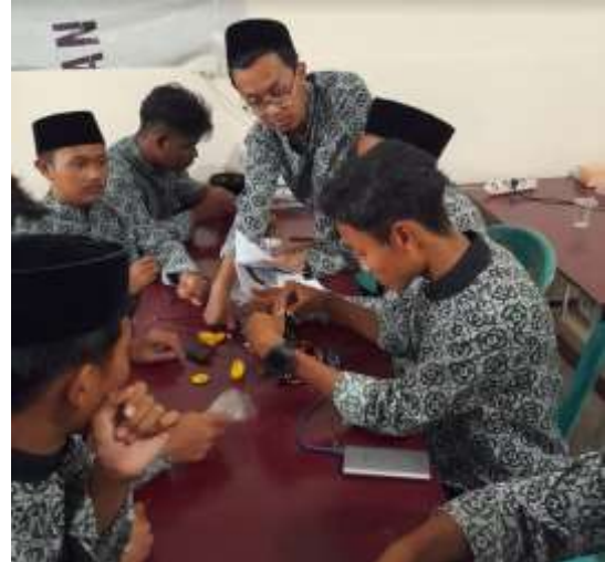
Gambar 2 Proses Literasi STEM pada tahun kedua

Tahap kedua dilaksanakan hari Jum'at, 1 Juli 2022 dengan menggunakan Zoom Meeting. Materi yang disampaikan adalah pengenalan pemrograman menggunakan software MakeBlock, para santri mencoba memprogram menggunakan laptop dan smartphone . Kegiatan selanjutnya pada tahun kedua ini dilaksanakan pada 15 September 2022 berlangsung. Materi yang disampaikan adalah perakitan beberapa jenis modul robot seperti robot line follower , robot laba-laba, dan robot lengan dengan mikrokontroler dan joystick .