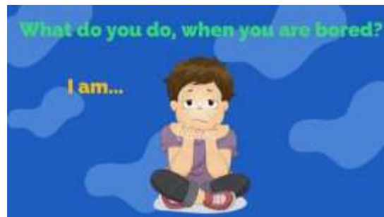
Materi Mengajar 2 (27-08-2022)