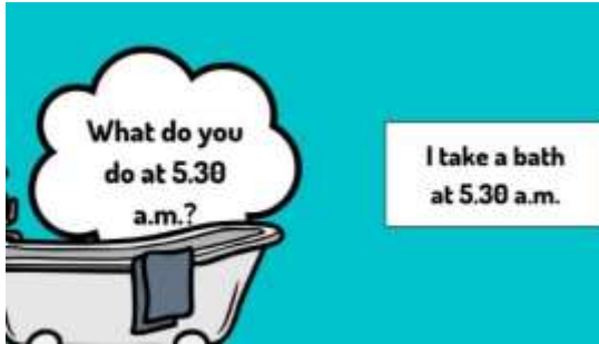
Materi Mengajar 5 (24-09-2022)