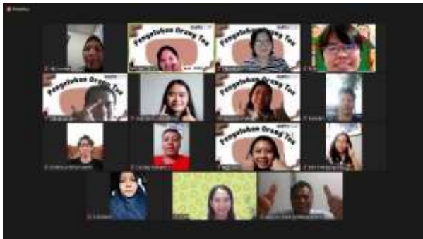
Gambar 2 : Penyuluhan Orang Tua 1 (13-08-2022)