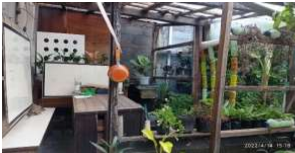
Gambar 1 : Lokasi Belajar Sanggar