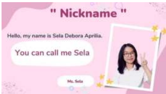
Materi Mengajar 1 (20-08-2022)