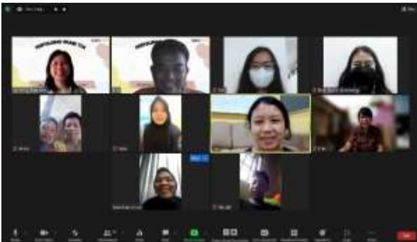
Gambar 3 : Penyuluhan Orang Tua 2