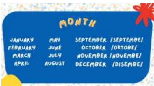
Materi Mengajar 3 (10-09-2022)