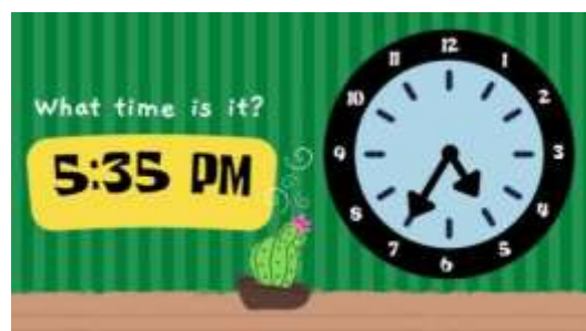
Materi Mengajar 4 (17-09-2022)