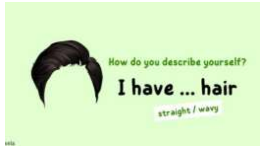
Materi Mengajar 6 (01-10-2022)