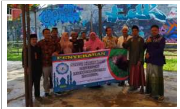
Gambar 4 Menyerahan Hewan qurban dan biaya penyembelihan

Kegiatan edukasi diakhiri dengan penyerahan hewan qurban sebanyak satu dan biaya penyembelihan hewan qurban dari Wakil rektor 1 Bidang akademik kepada pengurus DKM Kampung Tematik Drum Bujana Tigaraksa. Diberikan biaya pemotongan agar masyarakat tidak mengeluarkan biaya potong.