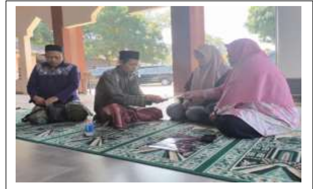
Gambar 2 Cara Akad Qurban

Setelah menjelaskan materi, narasumber ketiga menyampaikan beberapa pertanyaan dan pernyataan peserta agar kegiatan edukasi tidak monoton dan membosankan. Beberapa pertanyaan dilontarkan oleh peserta kegiatan dan dijawab dengan baik oleh narasumber, sehingga kegiatan edukasi terlaksana secara interaktif.