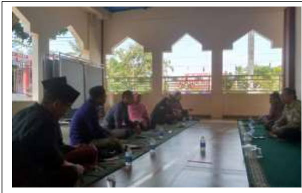
Gambar 2 Kegiatan Edukasi

Narasumber pertama sekaligus sebagai Wark 1 Bidang Akademik Universitas Insan Pembangunan Indonesia yang menyampaikan materi mengenai Maksud dan tujuan kegiatan Idul Adha dan dilanjutkan dengan penyerahan 1 ekor sapi hewan qurban dan sekaligus penyerahan dana pemotongan hewan qurban . Narasumber pertama menjelaskan maksud dan tujuan dari kegiatan pengabdian kepada masyarakat. Kegiatan PKM