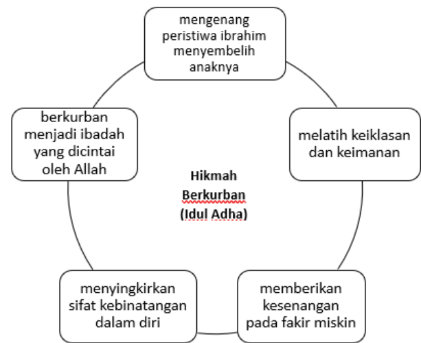
Gambar 3 Hikmah berqurban (Idul Adha)

Narasumber kedua menjelaskan mengenai hikmah idul qurban oleh narasumber pertama