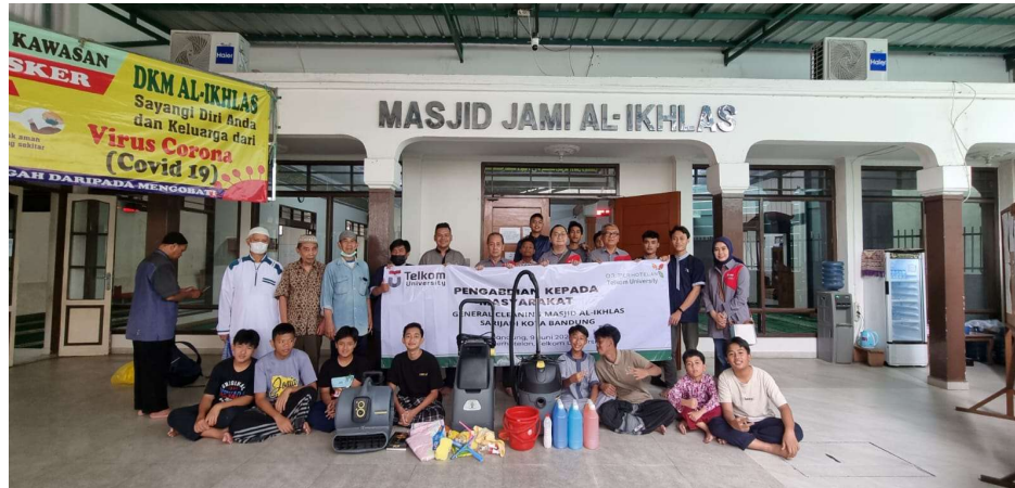
Gambar 1. Kegiatan Pembersihan

Pada proses General Cleaning area dalam Masjid yang berkarpet, masyarakat diberikan pengarahan dalam menggunakan mesin Carpet Shampoo beserta cara pengisian bahan pembersihnya. Setelah itu masyarakat diberikan kesempatan untuk mencoba dan melaksanakan proses pembersihan, sambil diberikan pengarahan dan pengawasan. Selesai melakukan shampooing dilanjutkan dengan melakukan vacuum terhadap sis-sisa kotoran karpet. Pada proses pembersihan mendalam di area tempat wudhu dan toilet, masyarakat diberikan pengarahan terlebih dahulu untuk perlengkapan yang dibutuhkan serta tata cara pelaksanaannya. Dengan menggunakan cairan Multi Purpose Cleaner (MPC) terlebih dahulu ke area yang akan dibersihkan dan mendiamkannya agar cairannya dapat bekerja terlebih dahulu. Lalu setelahnya itu kemudian disikat agar kotoran dan noda dapat terangkat secara detail dan dibersihkan dengan air.