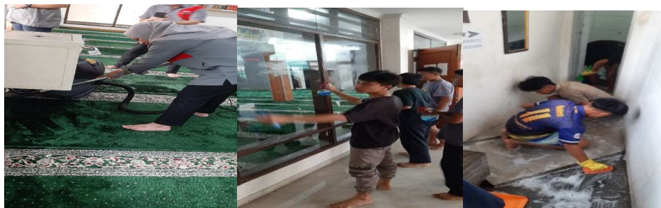
Gambar 1. Proses General Cleaning

Pada proses General Cleaning area dalam Masjid yang berkarpet, masyarakat diberikan pengarahan dalam menggunakan mesin Carpet Shampoo beserta cara pengisian bahan pembersihnya. Setelah itu masyarakat diberikan kesempatan untuk mencoba dan melaksanakan proses pembersihan, sambil diberikan pengarahan dan pengawasan. Selesai melakukan shampooing dilanjutkan dengan melakukan vacuum terhadap sis-sisa kotoran karpet. Pada proses pembersihan mendalam di area tempat wudhu dan toilet, masyarakat diberikan pengarahan terlebih dahulu untuk perlengkapan yang dibutuhkan serta tata cara pelaksanaannya. Dengan menggunakan cairan Multi Purpose Cleaner (MPC) terlebih dahulu ke area yang akan dibersihkan dan mendiamkannya agar cairannya dapat bekerja terlebih dahulu. Lalu setelahnya itu kemudian disikat agar kotoran dan noda dapat terangkat secara detail dan dibersihkan dengan air.