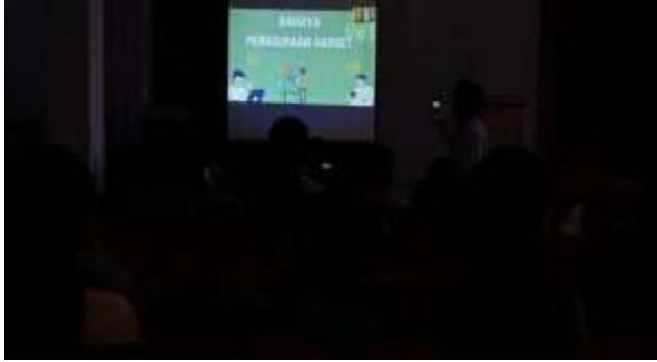
Gambar 4. Seminar Gadget, dengan bahan ajar video pembelajaran “Bahaya penggunaan Gadget”

sehingga dapat dipastikan video pembelajaran yang disediakan berhasil.