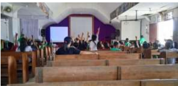
Gambar 6. Antusias anak dalam bertanya dan menjawab dalam seminar bahaya penggunaan gadget