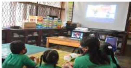
Gambar 2. Anak-anak ketika menunjukkan hasil kerjanya setelah diterapkan bahan ajar