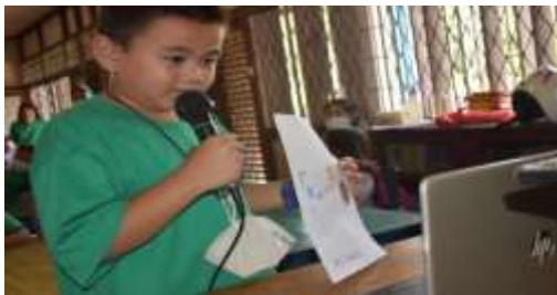
Gambar 1. Hasil penerapan bahan ajar dalam mendukung proses pembelajaran PPA

disesuaikan dengan kebutuhan anak-anak agar mereka tertarik melihat dan mempelajari. Melalui hal tersebut mentor melihat bahwa bahan ajar sangat membantu belajar anak-anak, terlihat dari niat tinggi anak-anak untuk semakin memahami apa yang telah disampaikan mentor. Hal tersebut dapat dilihat melalui beberapa lampiran gambar berikut;