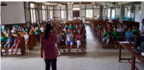
Gambar 5. Mentor memaparkan materi seminar bahaya penggunaan gadget