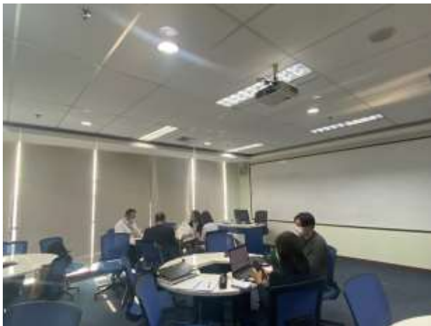
Gambar 3 (Dokumentasi konsultasi, 30 Agst' 2022)