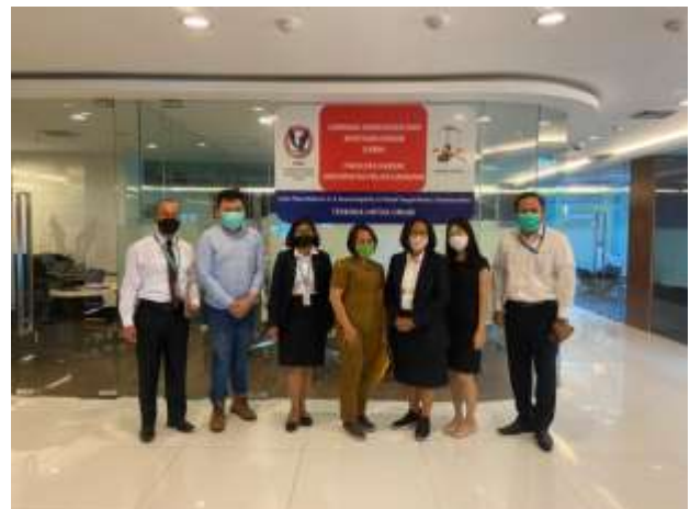
Gambar 2 (Dokumentasi konsultasi, 25 Jan' 2022)