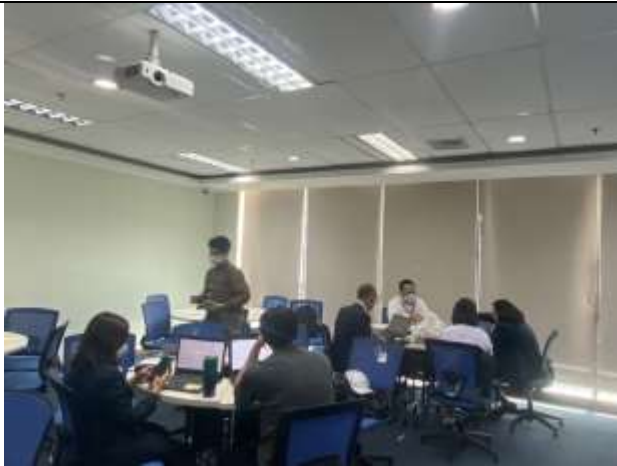
Gambar 3 (Dokumentasi konsultasi, 30 Agst' 2022)