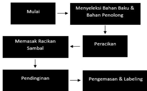
Tahapan proses pengolahan sambal kemasan

dapat ditemukan hal baru dan strategi baru untuk meningkatkan produksi. Dengan demikian hasil akhir dari kegiatan pengabdian ini adalah mitra telah dapat menaikkan hasil produksi dengan telah adanya label pada hasil produksi. Pendampingan berupa cara pemasaran sangat terbantu dengan adanya pelatihan penyusunan pembukuan sederhana, karena selama ini tidak ada catatan pembukuan