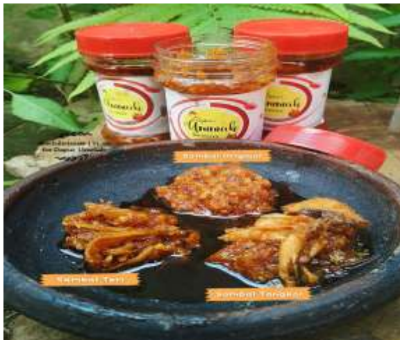
Gambar Produk Olahan Sambal