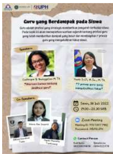
Gambar 1. Poster webinar edukasi online “Guru yang berdampak pada Siswa”

Kegiatan webinar edukasi online Yayasan Abar Indonesia dan Service Learning UPH dilaksanakan pada hari Senin, 18 Juli 2022, pukul 19:00 – 20:30 WIB melalui platform online Zoom, dengan judul “Guru yang Berdampak pada Siswa” (gambar 1). Kelompok, panitia, serta pemateri telah berada pada Zoom Meetings sejak pukul 18:30 WIB. Webinar edukasi online dibuka oleh MC pada pukul 19:00 WIB. Kemudian MC melanjutkan dengan pemberian sesi materi pertama dengan sub judul sesi “Warisan Zaman tentang Dedikasi Guru” oleh Ibu Cathryne B Nainggolan dan sesi materi kedua dengan sub judul sesi “Tujuh (7) Prinsip Guru yang Mengubah Hidup” oleh Ibu Yanti. Setelah kedua sesi materi selesai disampaikan, MC memimpin jalannya sesi tanya-jawab antara peserta dan para pemateri. Kemudian acara dilanjutkan dengan pengisian link evaluasi dan dokumentasi. Setelah itu, acara webinar diakhiri dengan penutupan oleh MC. Sesaat sebelum semua peserta meninggalkan Zoom Meeting, diadakan evaluasi singkat untuk panitia dan seluruh acara (gambar 2). Jumlah peserta yang mengikuti kegiatan webinar ini sebanyak empat puluh enam (46) peserta.