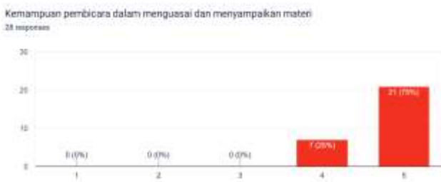
Gambar 5. Respon peserta tentang kemampuan pameri dalam menguasai dan menyampaikan materi

Berdasarkan isian evaluasi yang dilakukan peserta di atas, dapat terlihat bahwa isi materi yang disampaikan dapat diterima dan dipahami oleh peserta. Sebuah testimoni dari peserta webinar yang berprofesi sebagai kepala sekolah menyatakan bahwa webinar ini menyadarkan dan mengingatkan kembali urgensitas dari pentingnya kesadaran guru