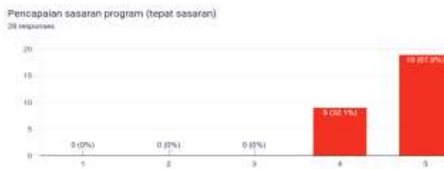
Gambar 4. Respon peserta tentang ketepatan sasaran materi