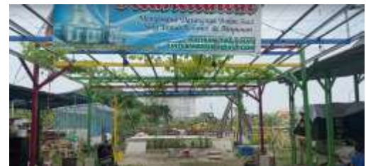
Gambar 3. Area Perkebunan dan Lorong Anggur