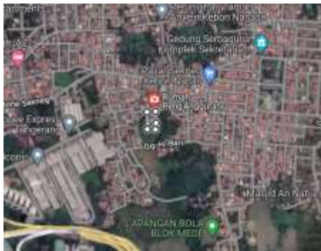
Gambar 1. Foto Lokasi Rumah Peng'Angguran

harus melihat potensi wilayah perencanaan. Oleh karena itu, keterlibatan masyarakat diperlukan. Keterlibatan masyarakat dalam tahap perencanaan adalah masyarakat dilibatkan dalam mengidentifikasi masalah, penentuan tujuan dan pengambilan keputusan terkait pengembangan kawasan (Dewi, Fandeli, & Baiquni, 2013).