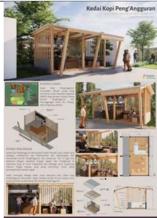
Gambar 8. Poster Desain Kedai Kopi Peng'Angguran

Desain yang diusulkan menyesuaikan dengan permintaan warga, yaitu berupa ruang berkumpul dan bersosialisasi sekaligus berfungsi sebagai UMKM yang berfokus pada penjualan produk pangan dari Rumah Peng'Angguran. Maka dari itu, Tim PkM mengusulkan sebuah desain kios UMKM yang dinamakan Kedai Kopi Peng'Angguran, yang diharapkan dapat menjadi suatu wadah yang sekaligus mempererat rasa kebersamaan dan kekeluargaan dari masyarakat Rumah Peng'Angguran dan sekitarnya. Hal ini juga erat kaitannya dengan maraknya budaya "ngopi" dan "nongkrong" di Indonesia, yang di mana masyarakat dari berbagai umur khususnya milenial hingga dewasa yang kerap berkumpul untuk saling bercengkerama sembari ngopi. Selain berfungsi sebagai kedai untuk berjualan kopi, Kedai Kopi Peng'Angguran diharapkan dapat menjadi tempat khusus warga untuk menjual produk andalan/khas dari Rumah Peng'Angguran.