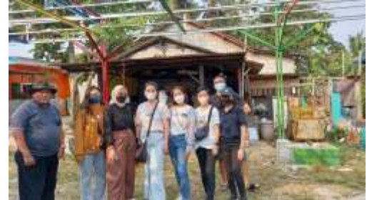
Gambar 6. Kunjungan dan observasi lapangan

perkebunan, peternakan, jalan setapak, area komunal, dan pospindu.