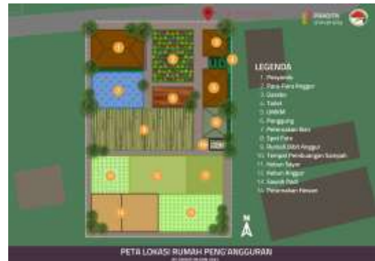
Gambar 9. Peta Lokasi Rumah Peng'Angguran