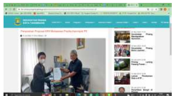
Kelurahan Panunggangan Utara

Pada tahapan berikutnya, Tim PkM telah menentukan salah satu programnya antara lain