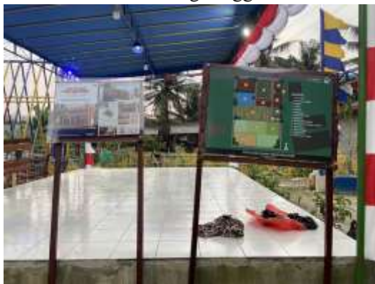
Gambar 11. Papan yang berisikan Poster Desain dan Peta Lokasi Rumah Peng'Angguran