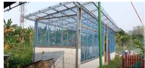
Gambar 2. Area Rumah Kaca untuk Bibit Anggur

Dalam area Perkebunan yang tergabung dengan area perkebunan anggur, direncanakan dapat ditanam tanaman lain seperti tanaman cabai sebagai tambahan variasi dari objek wisata edukasi. Kawasan ini termasuk menjadi objek wisata sebagai penunjang dari area UMKM. Kawasan lorong anggur ini diharapkan dapat dijadikan sebagai tempat masyarakat berkumpul dan bersosialisasi. Berdasarkan hasil survey, area lorong anggur masih belum sepenuhnya jadi terbangun, karena belum diberikan kanopi atau atap berwarna transparan di bagian atasnya sebagai penutup.