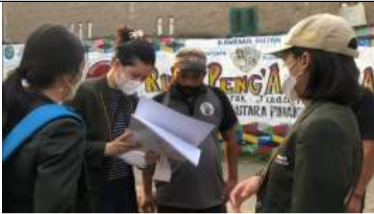
Gambar 10. Presentasi hasil produk oleh Tim PkM yang disaksikan oleh Sekretaris dan Ketua RT Rumah Peng'Angguran