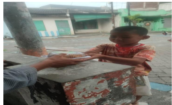
Gambar 15. Kemasan setelah pelatihan