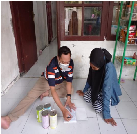
Gambar 16. Pelatihan Penempatan Celengan dan Pencatatan Pembukuan Sederhana

Pada gambar 16 merupakan pelatihan dan pendampingan yang dilakukan oleh anggota tim mengenai cara mengorganisir keuangan yang baik berdasarkan prosentase kebutuhan yang telah ditetapkan bersama-sama.