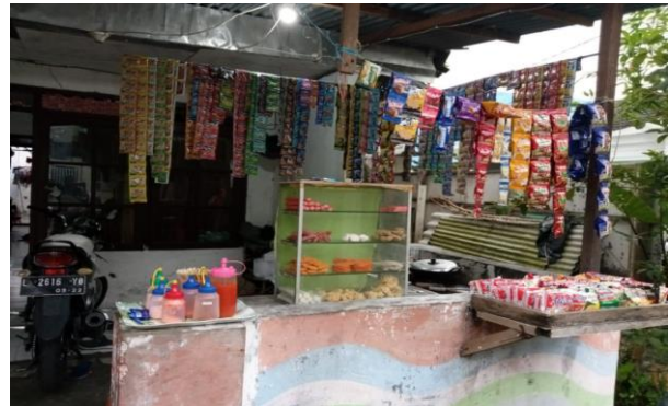
Gambar 1. Usaha dari Ibu Orien.

Pada saat ini banyak dari berbagai kalangan memulai merintis usaha sendiri. Usaha kecil rumahan yang telah berdiri di bidang usaha makanan dan minuman ringan selama kurun waktu 7 tahun. Dalam pendirian usaha ini, modal diperoleh dari pinjaman bank. Berkat modal usaha yang diberikan pemilik usaha mampu membuka sejumlah variasi makanan dan minuman seperti gambar 1 dan konsumen seperti gambar 2.