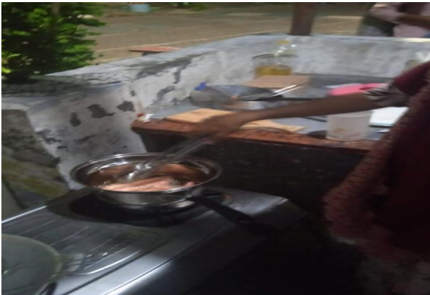
Gambar 9. Alat Produksi Setelah Pelatihan

Sebagai solusi penyelesaian, tim memberikan perlengkapan alat produksi yang higienis berupa wajan penggorengan seperti gambar 9 dan 10. Tim juga memberikan pendampingan ke Mitra cara penggunaan alat produksi baru tetap menjaga aspek kebersihan.