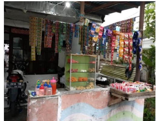
Gambar 11. Tampilan Sebelum Pelatihan

Dengan adanya rak ini, tata letak penempatan barang dagangan dapat tertata dengan rapi. Dan dengan adanya rak ini akan membantu Mitra untuk melakukan diversifikasi produk untuk produk yang dijualnya. Hasil dari pelatihan dan pendampingan ini diperoleh adanya peningkatan pendapatan yang cukup signifikan bagi Mitra yaitu 25% dari sebelumnya.