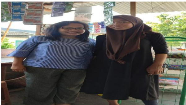
Gambar 3. Kunjungan dan Identifikasi Permasalahan Mitra

Kontaminasi terhadap bakteri dapat memungkinkan terjadi. Penggunaan alat produksi ini disebabkan keterbatasan pemahaman dan pengetahuan yang dimiliki oleh pelaku usaha terkait pentingnya kebersihan dari penggunaan alat produksi. Oleh karena itu, faktor ini dinilai perlu untuk membekali mitra dengan pengetahuan pentingnya menjaga kebersihan alat produksi. Tujuan dari pembekalan ini untuk meningkatkan kesadaran mitra terkait pentingnya menjaga kebersihan alat produksi. Tujuan menjaga kebersihan ini untuk tetap memelihara kondisi produk yang telah diolah dari kontaminasi bakteri.