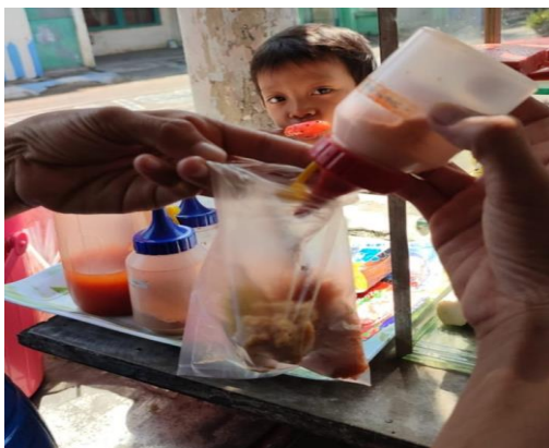
Gambar 13. Kemasan sebelum pelatihan

Pendampingan dilakukan untuk mengetahui pemahaman Mitra dalam mengikuti arahan pada saat pelatihan yang telah diberikan sebelumnya. Dari hasil pendampingan ini, Mitra telah berhasil melakukan perubahan kebiasaan dari penggunaan kemasan sebelumnya menggunakan kemasan dan label terbaru. Berkat pelatihan dan pendampingan ini, konsumen tidak hanya sebatas kalangan anak-anak tetapi juga ibu-ibu. Kemudian area pemasaran tidak hanya dikenal di wilayah RW dan RT Ibu Orien tetapi juga RW dan RT lainnya.