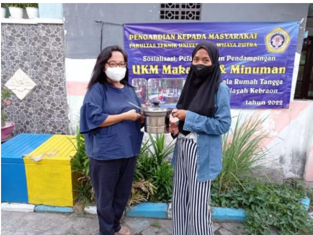
Gambar 10. Penyerahan Alat Produksi Saat Pelatihan

Di samping itu, tim memberikan rak untuk penempatan jualan chiki, wafer dan permen. Hal ini didasarkan pada saat observasi dijumpai lay-out dari penempatan chiki, wafer dan permen diletakkan di tempat apa adanya seperti pada gambar 11 dan gambar 12 adalah penyerahan rak kepada Mitra.