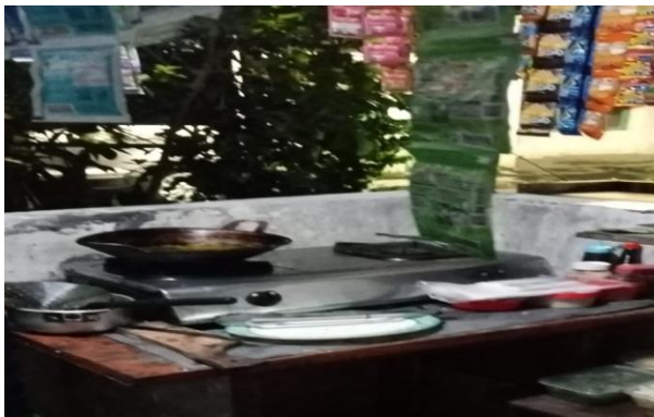
Gambar 4. Sistem produksi saat ini.

Kendala kedua, dari hasil observasi di lapangan. Ditemui selama ini, Mitra menggunakan kemasan berbahan plastik tipis seperti pada gambar