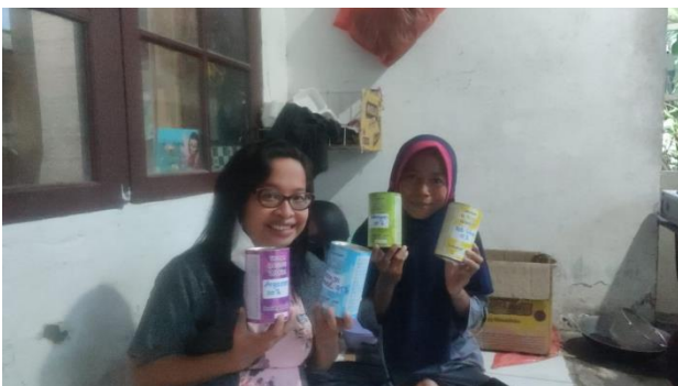
Gambar 7. Salah satu contoh pembekalan mengenai pentingnya menyisihkan hasil penjualan ke celengan.

Dari hasil diskusi dengan tim, maka salah satu pembekalan dari salah satu pemecahan permasalahan adalah memberikan materi tentang pentingnya pembukuan sederhana bagi pelaku usaha rumahan bidang pengolahan pangan. Di samping itu juga, memberikan 4 buah celengan untuk mempermudah mitra dalam mengalokasikan hasil penjualan setiap harinya seperti diperlihatkan pada gambar 7.