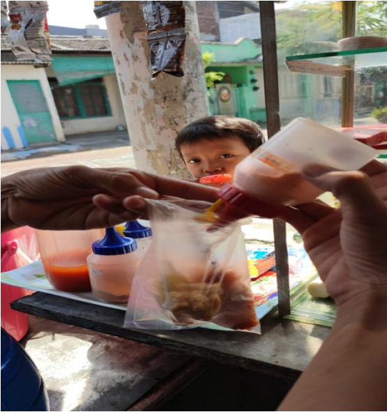
Gambar 5. Kemasan yang digunakan sebelum adanya kegiatan Pengabdian Kepada Masyarakat.

Kemudian hasil penjualan secara harian juga tidak terdapat pemisahan yang teratur dan terstruktur untuk kebutuhan jualan dan untuk kebutuhan sehari-hari seperti terlihat pada gambar 6.