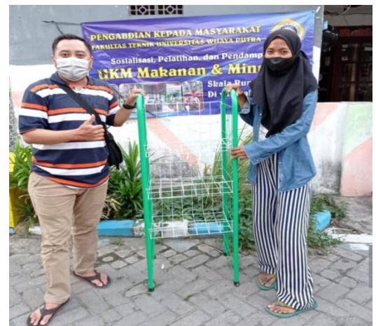
Gambar 12. Penyerahan Rak ke Mitra.