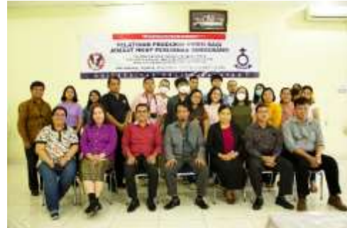
Gambar 4. Foto Bersama Peserta dan Panitia serta pengurus Gereja HKBP Perumnas 1 Tangerang

semangat pada anak muda gereja berlatih, ada peralatan multimedia baru yang khusus diadakan untuk pelatihan ini, serta nantinya bisa digunakan sebagai perangkat teknologi baru bagi gereja dan dimanfaatkan oleh anak muda dalam pelayanan di divisi multimedia.