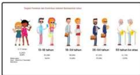
Gambar 1. Tingkat Penetrasi dan Kontribusi Internet Berdasarkan Umur

Selama ini yang lebih cepat beradaptasi adalah generasi muda yang lahir di masa-masa perkembangan teknologi sudah pesat di kisaran usia 13 – 18 tahun, dan 19- 34 tahun, terlihat pada tabel di bawah ini.