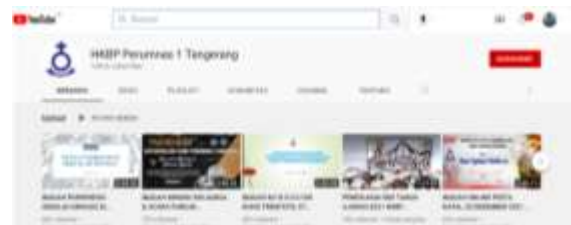
Gambar 2. Youtube HPBP Perumnas 1 Tangerang

jangkauan pengguna. Dari aktivitas secara face to face berpindah ke media cetak yaitu sarana tulisan atau buku yang disebarluaskan kepada jemaat, kemudian beradaptasi kembali menggunakan media online dengan memanfaatkan akun Youtube HKBP Perumnas 1 Tangerang yang sudah dibuat bahkan sebelum pandemi covid 19 muncul. Sudah berada pada jangkauan pengguna artinya proses adaptasi ini sudah bisa dilakukan segera karena berada dalam jangkauan atau sudah ada sistemnya. Tujuan penyampaian pesan berupa khotbah pendeta dan liturgi berhasil disampaikan kepada jemaat dengan media cetak, kemudian bertransformasi lewat media online. Ini merupakan cara Gereja HKBP Perumnas Tangerang beradaptasi dan menegosiasikan posisi di masyarakat di tengah situasi pandemi covid 19.