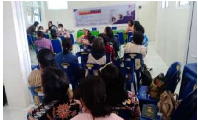
Gambar 3. Sosialisasi pelaksanaan workshop kurikulum merdeka dan merdeka mengajar.

pembelajaran dan pembuatan modul ajar kepada guru-guru di SMP 2 Negeri 2 Pangururan, Kabupaten Samosir.