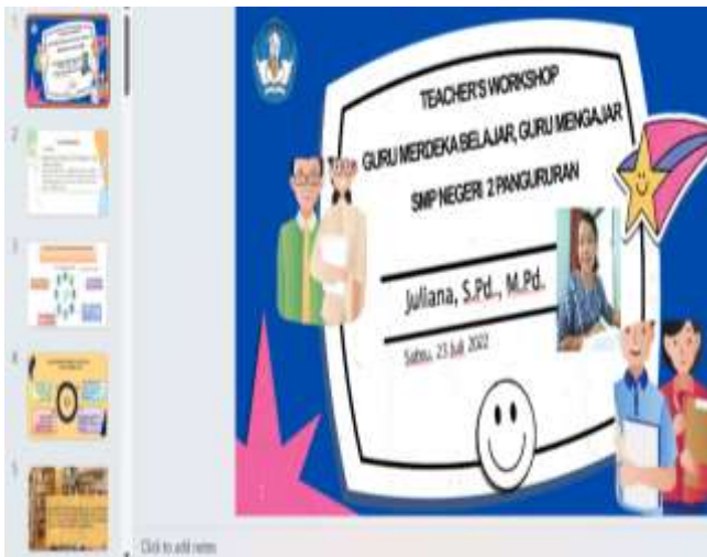
Gambar 4. Materi Workshop Implementasi Guru Merdeka Belajar dan Merdeka Mengajar

Setelah penjelasan materi sesi tanya jawab dan diskusi diberikan untuk memperdalam pemahaman terhadap materi yang diberikan. Di sesi akhir seluruh guru-guru yang mengisi lembar refleksi untuk mengetahui sejauhmana pemahaman guru terhadap implementasi merdeka belajar dan merdeka mengajar untuk diterapkan ke pada murid setelah pelatihan ini terlaksana.