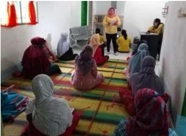
Gambar 1. Pelaksanaan Kegiatan Promosi Kesehatan