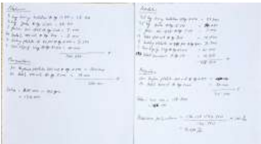
Gambar 4 Pencatatan Keuangan

Target luaran yang ingin dicapai dari pengabdian masyarakat ini antara lain adalah : 1). Untuk penataan pemasaran usaha, target luaran yang diharapkan adalah peningkatan omzet penjualan sebagai hasil dari adanya pem-branding-an dan pembuatan kemasan yang bagus sehingga dapat melakukan promosi di media sosial yang sedang trend in sekarang ini. 2). Di bagian keuangan, target luaran yang diharapkan adalah adanya pembukuan pada produksi sebagai hasil dari pendampingan dalam pembukuan produksi. 3). Untuk produksi, target luaran yang diharapkan adalah peningkatan kapasitas produksi sebagai hasil dari pendampingan untuk mendapatkan bantuan modal kerja dari lembaga keuangan maupun bantuan instansi pemerintahan pada usaha mikro.