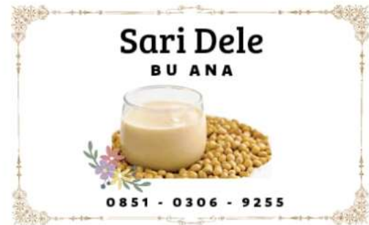
Gambar 5. Branding Mitra PKM

Berikut ini adalah Branding yang dilakukan selama Pengabdian Kepada Masyarakat