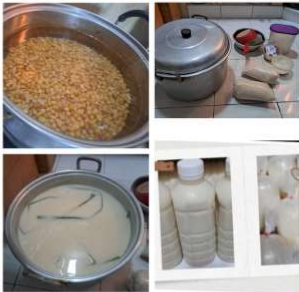
Gambar 2 Proses Pembuatan Sari Kedelai

Metode pengabdian masyarakat yang dimaksud dengan metode di sini ialah pola atau sistem tindakan yang akan dilakukan ataupun urutan atau tahapan-tahapan yang perlu dalam menjalankan kegiatan pengabdian-pengabdian kepada masyarakat. (Pradana, 2021).