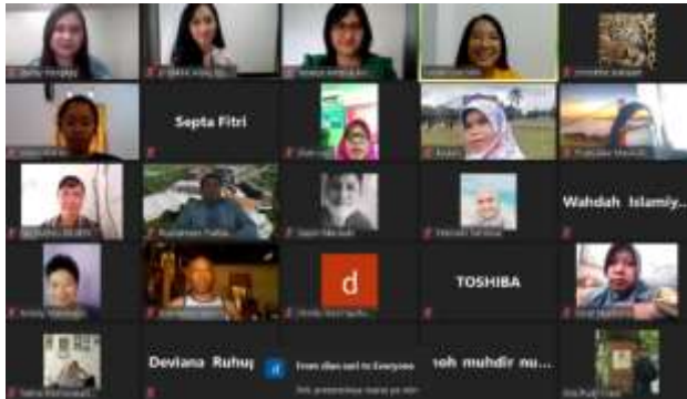
Gambar 8. Foto bersama tim PkM dengan sebagian peserta

Pada akhir sesi, tak lupa tim mengadakan foto bersama dengan para peserta sebagai dokumentasi.