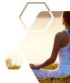
Gambar 7. Relaksasi Pernapasan untuk Menangani Distress

Secara keseluruhan, semua peserta tampak antusias pada saat kedua pembicara menyampaikan materi. Antusiasme juga ditunjukkan dari banyaknya peserta yang bertanya pada saat sesi tanya-jawab. Tidak ada kendala teknis selama sesi 1 dan 2, sehingga kedua sesi berjalan dengan lancar.