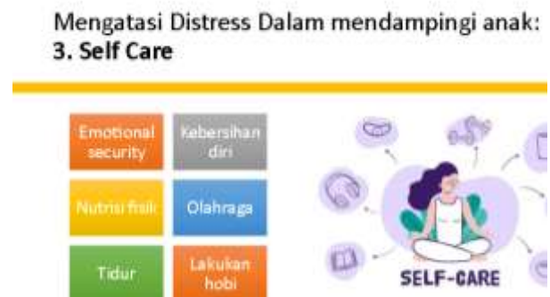
Gambar 6. Tips seputar self-care

Selanjutnya, pembicara memaparkan langkah-langkah mengatasi distress dalam mendampingi anak seperti mengatur waktu, mencari dukungan dari sekeliling, dan mempraktikkan self-care. Rincian self-care yang dibagikan pembicara adalah sebagai berikut: