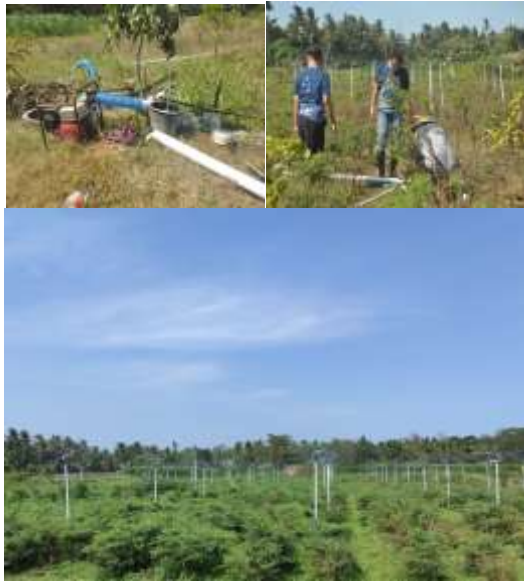
Gambar 4. Irigasi sprinkler di lahan tanam Indigofera .(Dokumen Pribadi).

Lahan kering merupakan hamparan lahan yang tidak pernah tergenang atau digenangi air selama periode sebagian besar waktu dalam setahun dan tipologi lahan ini dapat dijumpai dari dataran rendah (0-700 m dpl) hingga dataran tinggi (>700 m dpl). Lahan kering iklim kering secara umum didefinisikan sebagai suatu hamparan lahan yang tidak pernah digenangi atau tergenang air pada sebagian besar waktu dalam setahun, dengan curah hujan <2.000 mm/tahun dan mempunyai bulan kering >7 bulan (<100 mm/bulan). Di Indonesia, potensi lahan kering yang tersedia sangat luas lebih luas dari lahan sawah. Luas lahan kering di Indonesia seluas 144,47 juta ha atau 76,20% dari luas daratan Indonesia yang tersebar di Kalimantan seluas 41,61 juta ha, Sumatera 33,25 juta ha, Papua 28,60 juta ha, Sulawesi 16,57 juta ha, Jawa 10,27 juta ha, Maluku 7,45 juta ha, Bali dan Nusa Tenggara 6,70 juta ha. Tetapi dari luasan tersebut tidak seluruhnya berpotensi untuk digunakan sebagai lahan pertanian. Lahan kering yang potensial untuk pertanian seluas 99,65 juta ha atau hanya 68,98% yang berpotensi untuk pertanian, sisanya sekitar 44,82 juta ha tidak potensial