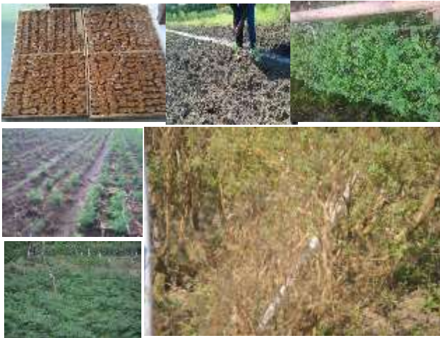
Gambar 2. Koleksi Budidaya Indigofera sp. A. menyiapkan media dalam polibag semai. B. menyiapkan lahan tanam, C. Bibit berumur 1,5 bulan siap dipindah ke lahan, D pemindahan bibit ke lahan tanam, E.. Tanaman Indigofera

Proses pemanenan perdana, dapat dilakukan setelah tanaman berumur 180 – 240 hari. Panen berikutnya dapat berjarak 9 hari atau setelah tumbuh subur. Tinggi pemotongan tanaman adalah 30 cm. Waktu pemanenan sebaiknya dilakukan pada sore hari pukul 16:00 WIB–17:00 WIB.