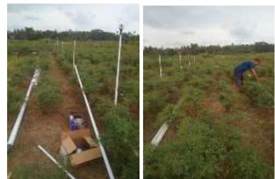
Gambar 3. Persiapan peralatan irigasi sprinkler di lahan yanam Indigofera . A. Pipa utama dan pila samping dengan besar berbeda, B. pemasangan pipa samping dan pipa tiang.

Desain sistem irigasi sistem curah atau sprinkler yang telah disepakati bersama, kemudian dilakukan pembuatan sumur bor dan pemasangan irigasi. Pembuatan sumur bor di lahan Indigofera mitra dibuat dengan kedalaman 20 meter, dengan titik lokasi sumur berada diantara kapling lahan Indigofera yang dimiliki mitra. Posisi sumur diletakkan pada posisi yang strategis sebagai sumber air yang dapat memenuhi kebutuhan air tanaman Indigofera . Setelah pemasangan sumur bor dilanjutkan dengan pemasangan pipa-pipa sistem irigasi sprinkler. Pemasangan sistem irigasi sesuai dengan desain yang telah disepakati pada kegiatan sebelumnya, dan untuk saat ini masih proses penyempurnaan pemasangan pipa pada sistem irigasi sprinkler (Gambar 3). Pola tata letak sistem irigasi yang dipasang adalah: a) Pipa utama dipasang sejajar, b) Pipa lateral dipasang tegak dengan arah lereng atau searah dengan garis tinggi, c) Pipa lateral sedapat mungkin tegak lurus pada arah angin, d) Menggunakan sprinkler yang pendek agar diperoleh distribusi yang seragam dan untuk memudahkan pegangan, dan d) Pemasangan pipa diusahakan memudahkan dalam operasinya.