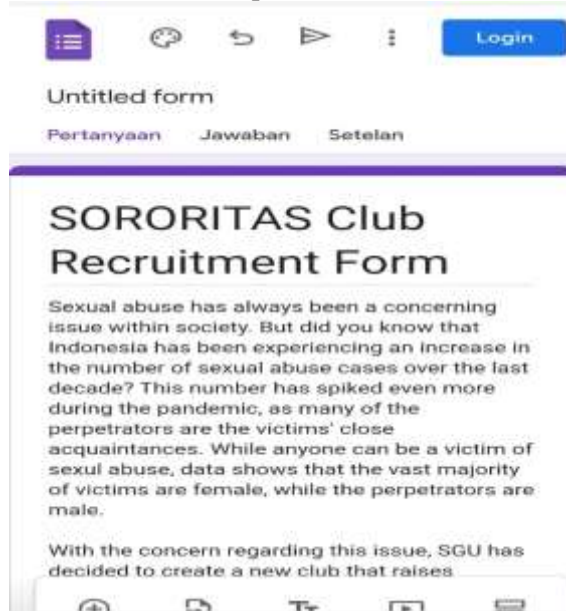
Gambar 2. Formulir pendaftaran Sororitas Club

Selain pengalaman menjadi aktivis anti kekerasan seksual, para anggota juga berhak memperoleh poin untuk mata kuliah Character and Professional Development Program (CPDP), yang terdiri dari rangkaian kegiatan kemahasiswaan yang memiliki bobot atau kredit yang dibangun berdasarkan visi & misi dan nilai-nilai SGU.