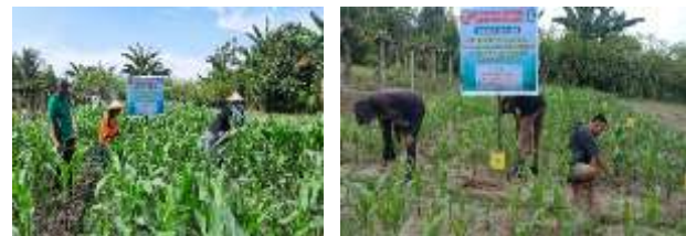
Gambar 3. Pengamatan serangan ulat grayak jagung pada lahan aplikasi ekstrak tumbuhan