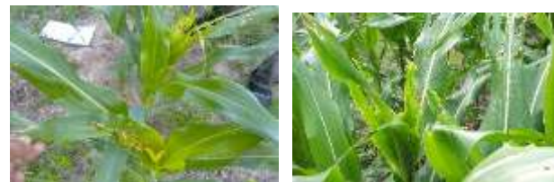
Gambar 2. Gejala tanaman jagung yang terserang ulat grayak

Dengan mengaplikasikan ekstrak tumbuhan sebagai insektisida botani khususnya untuk pengendalian ulat grayak jagung S. frugiperda , selain mengurangi penggunaan insektisida kimia sintetik, juga dapat meningkatkan pendayagunaan tumbuhan tersebut sebagai sumberdaya lokal yang selama ini hanya tumbuh liar dan belum banyak dimanfaatkan. Gejala serangan ulat jagung dan pelaksanaan pengamatan serangan ulat jagung masing-masing ditunjukkan pada Gambar 2 dan Gambar 3.