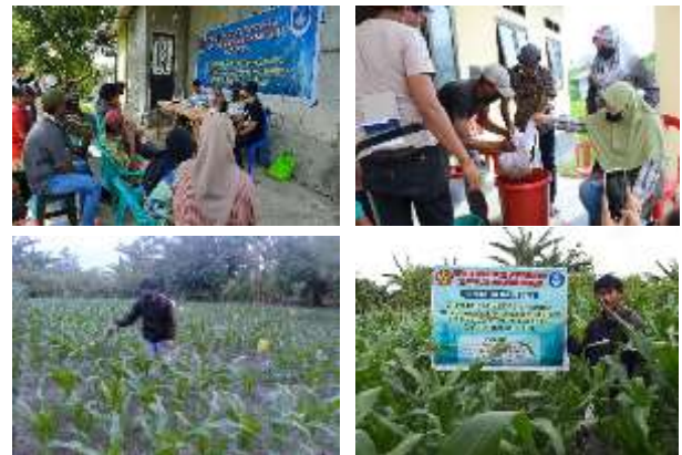
Gambar 1. Pelaksanaan penyuluhan, pelatihan, pembuatan ekstrak dan aplikasi ekstrak sebagai insektisida botani

Ekstrak tumbuhan yang diperoleh selanjutnya diaplikasikan pada pertanaman jagung. Konsentrasi ekstrak yang digunakan yaitu masing-masing 3%. Selama proses pelatihan pembuatan ekstrak, peserta dibimbing dan didampingi agar pembuatan ekstrak berlangsung dengan benar. Pelaksanaan penyuluhan, pelatihan, pembuatan ekstrak dan aplikasi ekstrak sebagai insektisida botani tampak seperti pada Gambar 1.