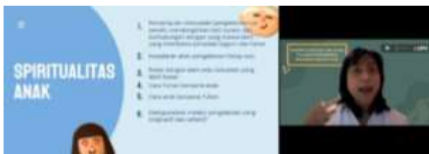
Gambar 4. Spiritualitas Anak

Pembicara selanjutnya meminta para peserta menuliskan definisi spiritualitas anak di kolom chat . Sambil membaca pendapat yang ada di kolom chat , pembicara masuk dalam pemaparan materi tentang spiritualitas anak. Menurut teori, spiritualitas anak adalah cara Tuhan bersama anak, cara anak bersama Tuhan, kesadaran akan pengalaman hidup suci dan diekspresikan melalui pengalaman yang imajinatif dan reflektif, relasi dengan alam atau kekuatan yang lebih besar, kemampuan menyadari pengalamannya sendiri, mendengarkan hati nurani, dan berhubungan dengan yang transenden yang membawa perasaan kagum dan heran.