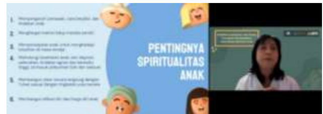
Gambar 5. Pentingnya Spiritualitas Anak

Setelah memastikan para peserta memahami definisi spiritualitas anak, fasilitator kembali mengajak mereka untuk menyampaikan pendapat dan alasan pentingnya mengembangkan spiritualitas anak melalui kolom chat di zoom . Pembicara membaca beberapa pendapat para peserta. Berbagai pendapat tersebut dibahas sambil memaparkan pentingnya mengembangkan spiritualitas anak.