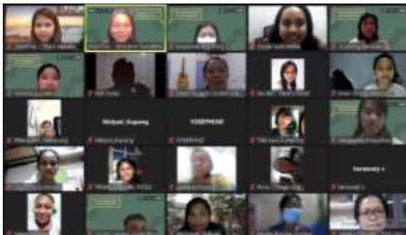
Gambar 9. Peserta Webinar

Berbagai komentar dan masukan dari para peserta berdasarkan angket evaluasi panitia penyelenggara adalah 1) mendapatkan banyak pengetahuan baru dari webinar ini; 2) webinar sudah berjalan dengan sangat baik; 3) melanjutkan webinar dengan topik spiritualitas yang sesuai perkembangan anak-anak zaman era digital; 4) sesi webinar perlu ditambah (waktu lebih panjang); 5) peserta dari Indonesia Timur terkendala waktu (karena mulai terlalu malam); dan 6) koneksi internet dari pihak penyelenggara dan para pembicara yang tidak stabil, sehingga jalannya kegiatan terganggu.