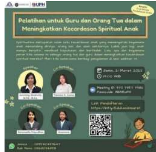
Gambar 2. Poster Pelatihan Guru dan Orang Tua

Hal-hal yang dilakukan untuk mempersiapkan pelatihan ini antara lain: 1) mencari beberapa sumber buku dan artikel jurnal; 2) menguasai konsep-konsep yang disampaikan dengan cara membaca materi, menulis kata kunci, dan berdiskusi bersama para fasilitator; 3) mempersiapkan presentasi dengan cara membuat PPT, wawancara anak sebagai bahan presentasi, dan mengumpulkan beberapa dokumentasi mengenai cara mengembangkan spiritualitas anak.