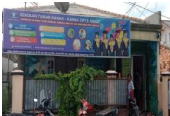
Gambar 1. TK Cipta Smart

betapa pentingnya spiritualitas anak dan cara meningkatkan spiritualitas anak.