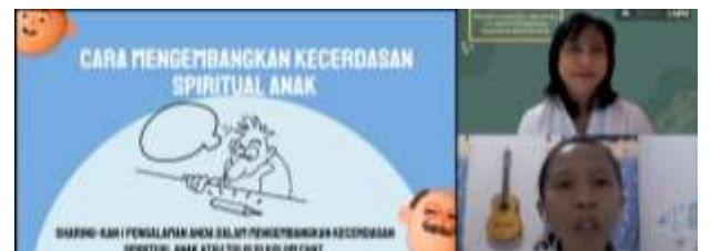
Gambar 6. Sharing Pengalaman

Fasilitator melanjutkan ke sesi berikutnya dengan meminta perwakilan peserta menceritakan secara singkat pengalaman dalam mengembangkan spiritualitas anak. Pembicara menanggapi sharing pengalaman tersebut dengan mengaitkannya ke teori dan pengalaman pembicara dalam mengembangkan spiritualitas anak. Penjelasan berlangsung secara interaktif dengan tampilan foto-foto dan video sebagai contoh.