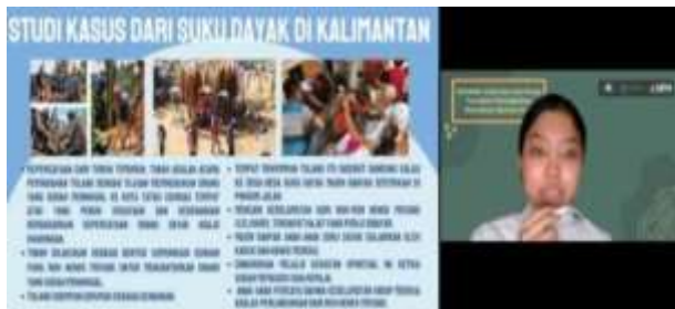
Gambar 3. Studi Kasus

Setelah itu, mahasiswa fasilitator membagikan link angket pembuka yang bertujuan mengetahui pengetahuan awal peserta mengenai pengertian spiritualitas anak yang mereka pahami selama ini. Salah satu mahasiswa fasilitator memulai dengan sebuah studi kasus. Ia menceritakan salah satu kisah spiritualitas anak yang dibesarkan pada wilayah Indonesia tertentu. Tujuan sharing adalah memberikan gambaran mengenai spiritualitas anak dalam kehidupan sehari-hari di dalam konteks masyarakat ia dibesarkan.