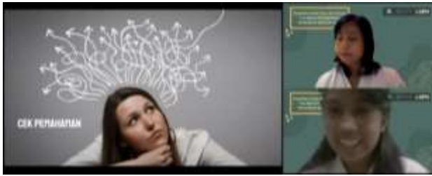
Gambar 7. Cek Pemahaman

Sebelum webinar berakhir, fasilitator menyimpulkan seluruh materi dan meminta para peserta untuk mengisi angket penutup dan evaluasi. Dalam angket penutup, para peserta diminta untuk menuliskan hal baru yang didapat mengenai spiritualitas anak, alasan pentingnya spiritualitas anak, dan rencana atau komitmen ke depan dalam mengembangkan spiritualitas anak.