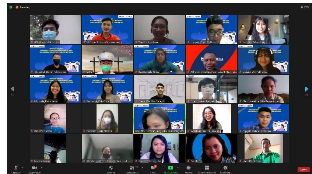
Gambar 4. Edukasi online sesi 2 via zoom.

aplikasi tersebut meliputi Edmodo , Testportal , Whiteboard , Baamboozle , Nearpod , Edpuzzle , Wordwall , Flipgrid , dan Quizzizz . Pada kegiatan ini juga mengikutsertakan 16 pembicara yang terdiri dari dosen, mahasiswa dan alumni yang berasal dari Fakultas Ilmu Pendidikan. Melalui workshop ini, partisipan akan diberikan kesempatan untuk diberikan pelatihan praktik mengenai penggunaan dan mempelajari fitur-fitur apa saja yang dapat digunakan melalui aplikasi-aplikasi pembelajaran tersebut yang tentunya bermanfaat untuk inovasi pembelajaran online yang dapat diberikan kepada siswa/i sekolah. Hal ini juga didukung oleh pernyataan Candiasa (2013) yang menyatakan bahwa kegiatan pelatihan yang diadakan melalui komunitas secara online dapat membantu guru dalam mengasah keterampilan mengelola pembelajaran dengan memanfaatkan web atau situs internet.