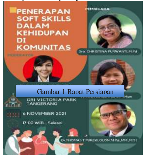
Gambar 1 Rapat Persiapan

Kondisi jemaat di GBI Victoria yang mayoritasnya adalah kelas menengah ke bawah maka tentu mengandung banyak masalah. Masalah-masalah tersebut antara lain: a) Kemampuan kritis masih sangat minim, tidak digunakan secara maksimal dalam melibatkan kemampuan berpikirnya secara kritis