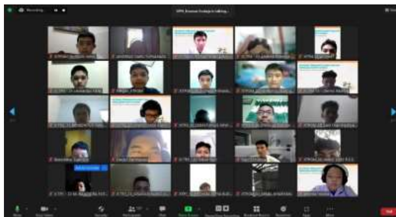
Gambar 13 Foto Peserta Webinar Tangkapan Layar III