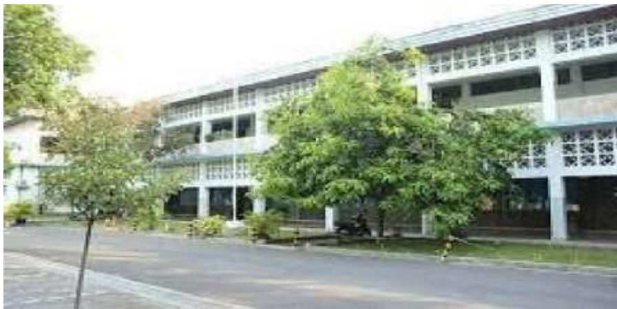
Gambar 2 Gedung SMK St. Mikael Surakarta

Visi SMK Katolik St. Mikael Surakarta adalah menjadi pusat pendidikan kejuruan unggul untuk membentuk pribadi yang kompeten, berhati nurani, peduli, dan berkomitmen. Sementara itu, misi sekolah ini, yaitu mendidik kaum muda menjadi pribadi yang memiliki kompetensi, kepekaan terhadap kemajuan zaman, karakter yang baik, kepedulian terhadap sesama dan lingkungan, wawasan kebangsaan, dan komitmen tinggi menyelenggarakan pembelajaran yang mengarah pada terwujudnya kompetensi abad 21; mengelola pendidikan dengan sistem manajemen mutu yang efektif dan efisien; menyediakan dan mengembangkan sumber daya manusia yang profesional, tanggap secara kritis terhadap perkembangan teknologi informasi, sejahtera, bermartabat dan beriman; dan menyediakan dan mengembangkan sarana dan prasarana yang memadai dan sesuai dengan perkembangan teknologi.