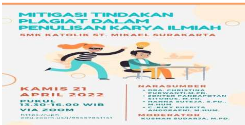
Gambar 3 E-Poster PkM

Kegiatan PkM ini dimulai dari diskusi antara Ketua PkM dengan pimpinan sekolah SMK St. Mikael, Surakarta. Hasil diskusi mengidentifikasi bahwa pimpinan sekolah menghadapi fenomena tingginya tingkat plagiasi di kalangan siswa SMK St. Mikael, Surakarta. Kepala Sekolah mengharapkan sebuah program edukasi yang dapat mencegah siswa dari pengerjaan tugas yang hanya sekedar saling copy-paste atau menyalin pekerjaan di antara siswa. Para siswa membutuhkan pengetahuan, pemahaman, pengenalan, dan pembelajaran tentang hal-hal yang mendasari suatu tindak plagiarisme dari awal sehingga para siswa menyadari praktik akademik yang baik dan cara yang tepat untuk menghindari plagiarisme. Selanjutnya, tim anggota PkM melakukan koordinasi terkait rencana pelaksanaan PkM.