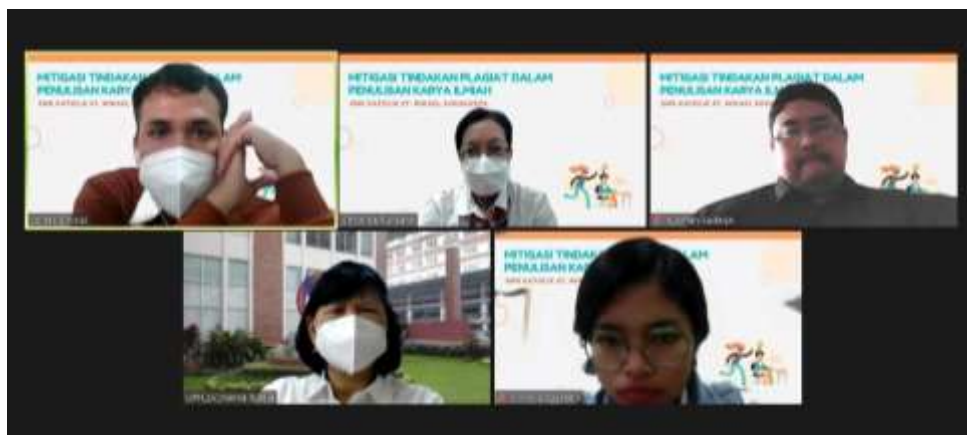
Gambar 4 Foto Pertemuan Tim PkM

Dalam rangka merespons harapan kepala sekolah St. Mikael agar siswa memiliki pengetahuan, pemahaman, pengenalan, pembelajaran tentang hal-hal yang mendasari suatu tindak plagiarisme dari awal sehingga para siswa menyadari praktik akademik yang baik dan cara yang tepat untuk menghindari maka Tim PkM menawarkan solusi dengan memberikan pelatihan melalui webinar yang dapat membuka wawasan siswa SMK St. Mikael tentang hal-hal yang mendasari suatu tindak plagiarisme dari awal sehingga para siswa menyadari praktik akademik yang baik dan cara yang tepat untuk menghindari plagiarisme. Adapun webinar sudah dilaksanakan pada hari Kamis, 21 April 2022, pukul 13.30 – 16.00 WIB, dengan rincian waktu seperti pada tabel 1 berikut ini.