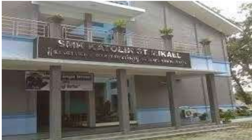
Gambar 1 SMK St. Mikael Surakarta