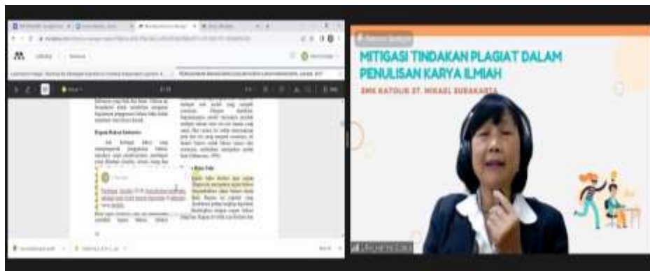
Gambar 8. Penyampaian topik 3 “Pengenalan Parafrasa sebagai Mitigasi Dini dalam Tindakan Plagiat”

parafrasa. Pendapat ahli yang dimaksud adalah “Ragam baku disebut juga ragam ilmiah. Ragam ini merupakan ragam bahasa orang berpendidikan yakni bahasa dunia Pendidikan” (Jamilah, 2017). Beberapa bentuk parafrasa yang dimaksud bisa menjadi “Menurut Jamilah (2017) nama lain ragam baku adalah ragam ilmiah. Variasi bahasa ini digunakan dalam komunikasi di kalangan mereka yang berpendidikan, “Di kalangan orang berpendidikan jenis bahasa yang digunakan adalah bahasa baku. Oleh karena itu, ragam ilmiah identik dengan ragam baku (Jamilah, 2017)” dan “Jamilah (2017) menyebutkan laras baku sebagai laras ilmiah karena digunakan di kalangan orang terdidik”.