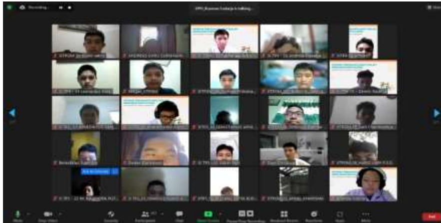
Gambar 13 Foto Peserta Webinar Tangkapan Layar II