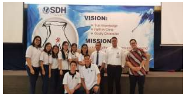
Gambar 1.6 Foto bersama pemateri dan fasilitator first aid