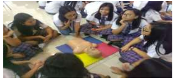
Gambar 1.3 Kelompok praktik hands only CPR