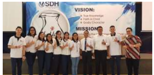
Gambar 1.7 Foto bersama pemateri dan fasilitator first aid