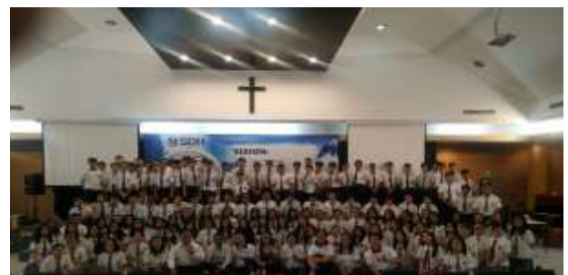
Gambar 1.7 Foto bersama Tim Universitas Pelita Harapan dan peserta SDH Lippo Village