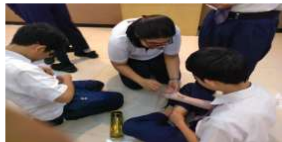
Gambar 1.3 Kelompok praktik penggunaan elastis perban