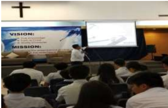
Gambar 1.1 Penjelasan materi pertolongan pertama ( first aid ) & tanya jawab lisan

Setelah materi disampaikan, acara dilanjutkan dengan praktik secara langsung mengenai bagaimana cara melakukan Bantuan Hidup Dasar (BHD) “ Hands-only CPR ” dan cara menggunakan elastic perban pada kondisi sprain dan strain selama 40 menit. Peserta dibagi menjadi 10 kelompok kecil yang didalamnya terdapat masing-masing satu orang fasilitator. Dari 10 kelompok tersebut, dibagi lagi menjadi lima kelompok belajar dan latihan melakukan BHD dan lima kelompok belajar dan latihan mengenai penggunaan elastis verband pada kasus strain dan sprain. Setelah 20 menit belajar dan latihan, masing-masing kelompok akan bertukar tempat, sehingga semua peserta akan mendapatkan dua keterampilan yaitu bagaimana cara melakukan BHD “ Hands-only CPR ” dan penggunaan elastis verband.