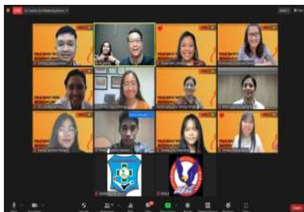
Gambar 3. Panitia pelaksana kegiatan Webinar disiplin pada anak