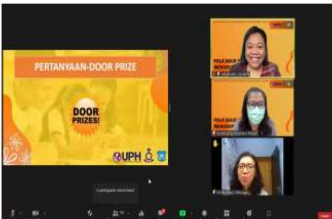
Gambar 4. Kegiatan penutup: Door prize

ada guru-guru sekolah minggu yang berpartisipasi dalam kegiatan ini, karena materi yang diberikan memperlengkapi mereka sebagai guru sekolah minggu dalam mendisiplinkan anak didik mereka. Di akhir kegiatan, aktivitas interaktif berupa door-prize dilakukan. Peserta diberikan pertanyaan acak terkait materi, dan diminta untuk menjawab pertanyaan dengan cepat dan tepat, seperti terlihat pada gambar 4.