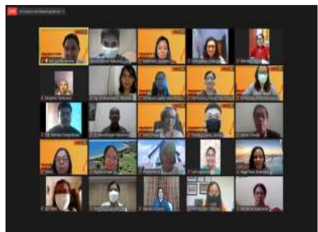
Gambar 3b. Peserta Webinar Pola Asuh yang Mendisiplinkan Anak

nenek, atau orang dewasa lainnya. Selain itu juga