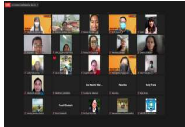
Gambar 2a. Peserta Webinar Pola Asuh yang Mendisiplinkan Anak

Gambar 3a dan 3b merupakan beberapa gambar yang terekam, menunjukkan peserta yang hadir dalam kegiatan PkM. Peserta yang hadir bukan saja orang yang memiliki anak usia toddler sampai usia sekolah, namun juga orang yang terlibat dalam kehidupan anak-anak, seperti kakek