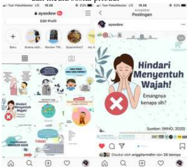
Gambar 2. Beberapa konten edukasi secara online untuk pencegahan penularan Covid-19