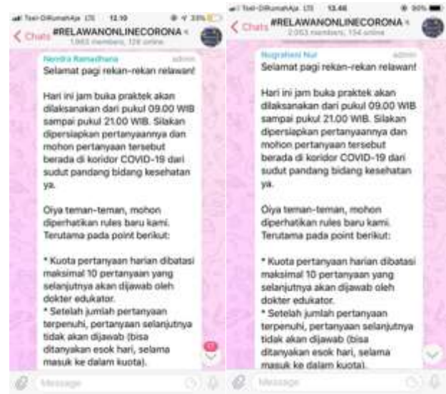
Gambar 1. Mengikuti diskusi tanya jawab relawan online corona via telegram

Berdasarkan permasalahan yang ada maka dilakukan program kerja sosialisasi pembuatan masker sendiri ( do it yourself atau DIY), pentingnya pemakaian masker, social distancing dan cuci tangan online melalui group chat dalam berbagai versi video, maupun poster. Serta melakukan pencetakan poster dan selebaran guna menambah informasi, dan sosialisasi dengan pembuatan infografis tentang gizi-gizi makanan dan contoh-contoh menu sehat guna menghadapi COVID-19. Tujuan program kerja ini adalah untuk memberikan awareness masyarakat Puspas Tipes mengenai pentingnya penggunaan masker sebagai salah satu tindakan preventif dari pencegahan virus Corona, kemudian juga memberikan pemahaman mengenai pentingnya jaga jarak dikarenakan masih banyaknya masyarakat yang berkerumun dan bergerombol contohnya adalah di pos ronda, sehingga harus diberikan edukasi bahawa sangat penting untuk menjaga jarak dimasa pandemi. Kemudian yang terakhir adalah penerapan PHBS yaitu Perilaku Hidup Bersih dan Sehat dikarenakan masih minimnya tempat cuci tangan dan kebanyakan masyarakat tipes tidak mengetahui langkah-langkah cuci tangan yang benar sehingga perlu adanya edukasi secara langsung serta pembuatan tempat cuci tangan di berbagai spot keramaian di RT 02 RW 05 Tipes. Program kerja dalam bidang kesehatan dengan PHBS (Perilaku Hidup Bersih Sehat) sudah terlaksana dengan baik pada rentang waktu 35 hari.