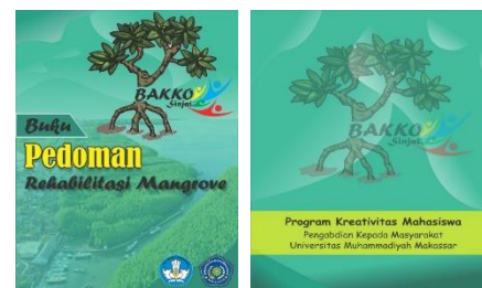
Gambar 2. Hasil desain sampul buku pedoman