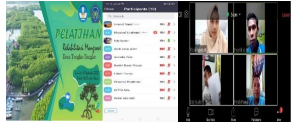
Gambar 5. Proses pelaksanaan pelatihan rehabilitasi mangrove via zoom

sedikit memberikan gambaran dan manfaat dari rehabilitasi mangrove di Desa Tongke-Tongke.