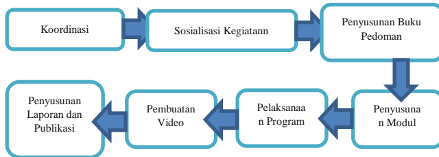
Gambar 1. Flow map Metode Pengembangan