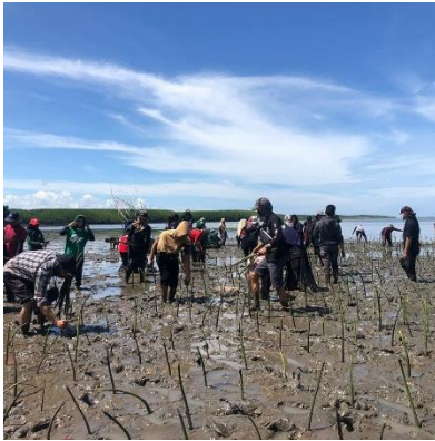
Gambar 6. Dokumentasi mandiri oleh pemuda Desa Tongke-Tongke