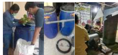
Gambar 9. Percobaan pada biogas dan pirolisis

Pelatihan diberikan pada mitra terkait dengan pengoperasian dan perawatan alat. Serta bagaimana memanfaatkan hasil dari proses konversi sampah menjadi energi dan pupuk. BBM hasil pirolisis perlu dilakukan pengendapan dan pemurnian sebelum digunakan untuk menghidupkan Genset. Biogas yang dihasilkan dari reactor ditampung dalam tempat khusus. Biogas tersebut dialirkan pada sebuah tabung yang sudah dilengkapi dengan filter. Filter ini bertujuan untuk menghilangkan gas impurities seperti CO 2 dan H 2 S. sehingga gas metan CH 4 dapat digunakan secara optimal.