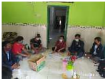
Gambar 3. Kegiatan FGD bersama Kepala Desa dan perangkatnya

Hasil dari pelaksanaan FGD yaitu permasalahan tentang sampah yang ada di desa Glagaharum, dengan hal itu tim PHP2D memberikan solusi tentang bagaimana pengolahan sampah dengan teknologi pirolisis dan biogas yang akan menghasilkan BBM setara solar yang akan dimanfaatkan untuk penerangan jalan.