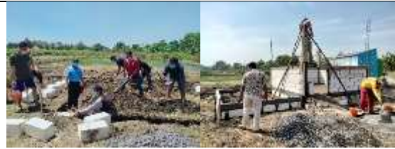
Gambar 8. TPST pada program PHP2D

Sampah organik yang berasal dari rumah tangga akan diproses menggunakan reactor biogas yang terbuat dari drum plastic. Selain menghasilkan Biogas yang akan digunakan untuk memanaskan alat Pirolisis, reactor dapat menghasilkan residu berupa lumpur organik yang dapat digunakan sebagai pupuk. Gas yang dihasilkan juga dapat digunakan untuk menghidupkan mesin Genset berbahan bakar Hybrid (Minyak dan Gas). Tempat pengolahan sampah terpadu (TPST) ini dilengkapi dengan rumah produksi untuk penempatan alat dan tempat pemilahan sampah sementara.