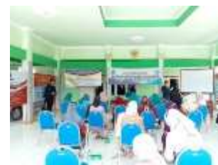
Gambar 6. Pelaksanaan Pretest dan Posttest

Pada hari Minggu tanggal 8 Agustus ibu-ibu PKK diberikan beberapa pertanyaan yang relevan dalam bentuk Pre-test, kepada ibu PKK dan warga diberikan edukasi dan sosialisasi tentang sampah organik dan organik. Kemudian diberikan beberapa pertanyaan dalam bentuk post-test untuk mengetahui tingkat pengetahuan warga tentang sampah rumah tangga.