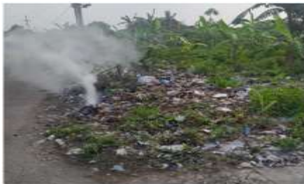
Gambar 2. Pembakaran sampah di ruang terbuka

Warga juga melakukan pembakaran sampah di tepi jalan atau di dekat sungai. Proses pembakaran tersebut tidak sempurna sehingga memicu terjadinya pencemaran lingkungan baik tanah, air maupun udara.