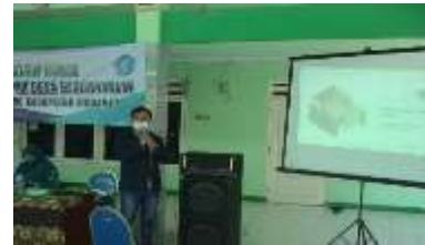
Gambar 4. Kegiatan sosialisasi bersama PKK

Sosialisasi dan pengenalan program yang dilakukan pada warga, menunjukkan bahwa warga dapat menerima dan mempunyai antusias untuk melaksanakan program dari tim PHP2D. Kegiatan sosialisasi Tim PHP2D yang pertama pada hari Minggu tanggal 8 Agustus 2021 di kantor Balai Desa dan dihadiri oleh ibu-ibu PKK Desa Glagaharum.