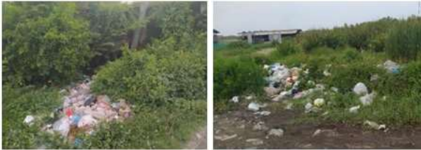
Gambar 1. Pembuangan sampah oleh warga

Berdasarkan hasil wawancara yang dilakukan oleh tim Program Holistik Pemberdayaan dan Pembinaan Desa (PHP2D) kepada kepala desa Glagaharum, bahwa sebanyak 5 RT terkena dampak dari semburan lumpur Lapindo. Akibatnya desa tersebut mengalami kesempitan lahan. Masyarakat tidak mempunyai tempat untuk pembuangan sampah. Sehingga sampah tersebut di buang disembarang tempat.