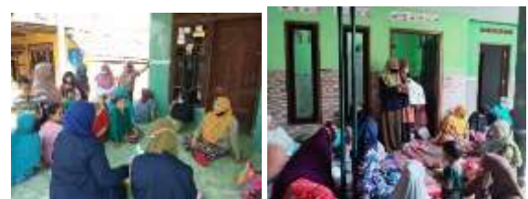
Gambar 5. Sosialisasi door to door

Pengenalan program ini bertujuan untuk mengenalkan pentingnya menjaga lingkungan sekitar dan juga cara pemilahan sampah dari rumah tangga. Sosialisasi kedua pada hari Minggu tanggal 29 Agustus 2021 yang dilakukan secara offline dengan mengambil 3 RT yaitu RT16, RT 11, dan RT 14 di desa Glagaharum, Kegiatan sosialisasi ini dilakukan secara door to door .