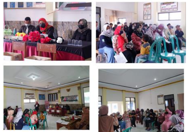
Peningkatan Kapasitas Kelompok Wanita Tani Desa Barusari Kecamatan Pasirwangi Kabupaten Garut

f. Pelaporan , disampaikan kepada semua lembaga mitra dilaksanakan pada pertengahan program dan di akhir program