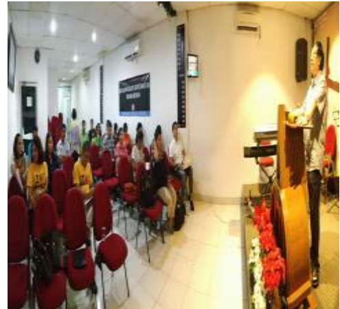
Gambar 1. Kegiatan pembekalan jemaat

dengan anak remaja, supaya mereka berani terbuka menceritakan pengalaman spiritual mereka kepada orang tua. Menurut Nye (2014), spiritualitas anak adalah berbagai cara Tuhan bersama anak dan berbagai cara anak untuk hidup di dalam Tuhan. Jadi spiritualitas anak merupakan kapasitas alami yang tumbuh di dalam diri anak untuk menyadari bahwa ada pengalaman hidup yang kudus.