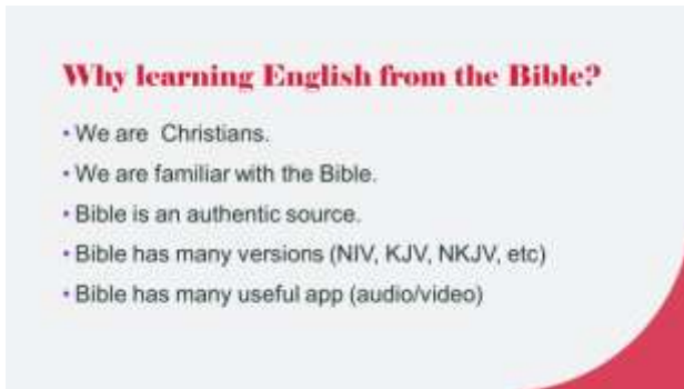
Gambar 6. Slide Webinar

Pada konsep kembali dan mengaplikasikan dapat terlihat pada penyiapan aktivitas tindak lanjut bagi peserta. Bahwa para pendamping secara jelas menyiapkan aktivitas tindak lanjut yang akan membantu para peserta di dalam upaya menerapkan hasil webinar pengenalan jati diri, karakter, spiritualitas, dan belajar Bahasa Inggris melalui Alkitab. (Furjanic & Trotman, h. 167). Salah satunya dengan tanya jawab dari tiap sesi.