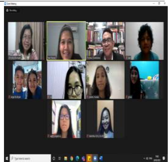
Gambar 3. Kegiatan Webinar

Tahap berikut yang merupakan tahap ketiga adalah tahap penyampaian konsep. Setiap pendamping dengan sendirinya harus memahami setiap problem kehidupan remaja yang berkaitan erat dengan memahami andragogi para peserta remaja dan orang tua yang selalu mengaitkan kebutuhan belajar dengan aktivitas pekerjaan, dan terutama tentang penyelesaian atas berbagai masalah. Setiap pendamping memiliki pertimbangan etis dari pola dan gaya hidup kaum remaja dan orang tuanya. Kegiatan pendampingan pun disertai dengan beragam materinya untuk masing-masing pertemuan yang bisa secara langsung menjawab beraneka kebutuhan (Furjanic & Trotman, h. 62)