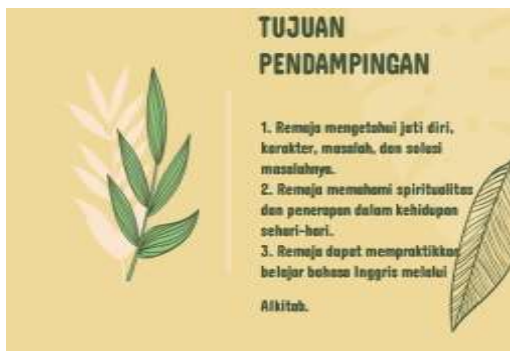
Gambar 4. Slide Tujuan Pendampingan

Uraian secara detail, konsep pemikiran LEARN dapat teridentifikasi secara langsung dari beberapa aktivitas pendampingan. Terlihat secara jelas, konsep mendengarkan dan memahami, terlihat secara jelas dari penyampaian tujuan pendampingan ini pada aktivitas di kegiatan pertama. Pada Gambar 4 di bawah ini terlihat salah satu slide yang dipaparkan pada pertama yang berisikan tujuan pelatihan atau pendampingan