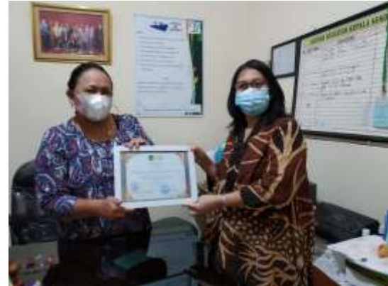
Gambar 8. (Penyerahan Sertifikat Penghargaan Sebagai tanda Terima kepada SMA Karya Enam Enam Jakarta)