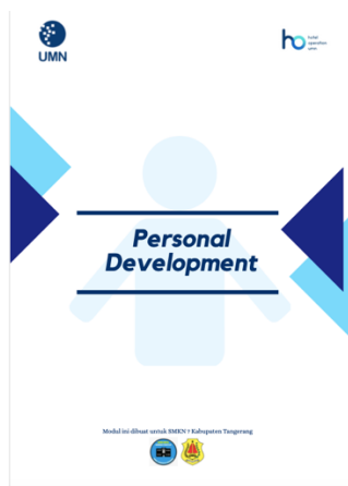
Gambar 1. Tampilan depan Modul Personal Development

Kegiatan ini menjawab pertanyaan urgensi masalah siswa vokasi tentang memberikan materi personal development pada saat pandemi Covid-19. Kegiatan ini juga membahas dan berdiskusi tentang hambatan dan kesempatan yang dapat ditangani oleh siswa perhotelan pada situasi pandemi Covid-19. Kegiatan ini telah mencapai tujuannya yakni memberikan persiapan secara mental dan pengembangan diri yang dibutuhkan siswa perhotelan pada situasi pandemi. Dengan pembahasan dan diskusi secara dua arah, kegiatan ini dapat memberikan solusi akan hambatan dan gambaran kesempatan yang akan dihadapi oleh siswa perhotelan pada pandemi Covid-19.