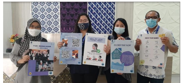
Gambar 5. Pemberian Poster untuk SMKN 7 Kabupaten Tangerang “ Personal Development ”