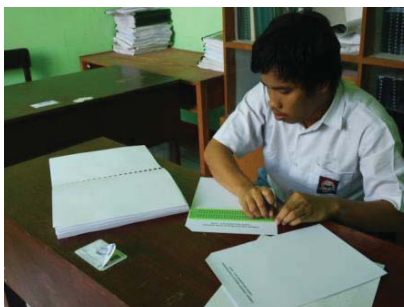
Gambar 1. Pelaksanaan UAN di SLB A YPTN Mataram. Tampak salah satu peserta sedang mengerjakan naskah soal Braille .

Pelaksanaan UAN setiap tahunnya dilaksanakan setiap akhir semester Ganjil. Untuk tingkat Sekolah Menengah Atas (SMA), biasanya dilaksanakan bulan April. Misalnya tahun 2018 pelaksanaan UAN untuk Sekolah Menengah Kejuruan (SMK)