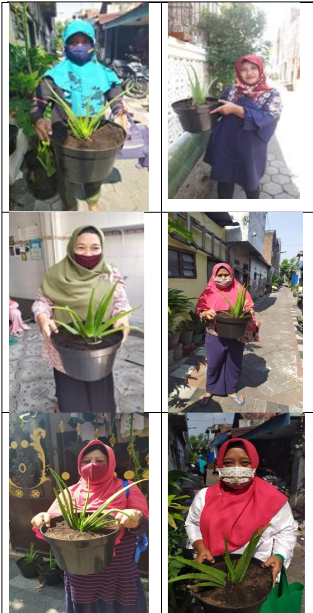
Gambar 4. Bibit lidah buaya dan penyerahan bibit kepada ibu-ibu PKK

Dampak dari kegiatan pengabdian masyarakat adalah warga khususnya pemuda karang taruna dan ibu-ibu PKK mendapatkan pengetahuan tentang pembuatan mural (lukisan di dinding) dan cara budidaya lidah buaya.