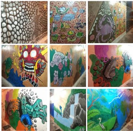
Gambar 2. Hasil pembuatan mural